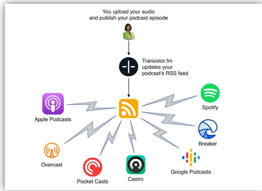
Slika 2.1 Proces postavljanja podcasta na platforme

programa preuzeli su datoteku i prenijeli je u iPodder , program kojim se datoteka direktno sinkronizirala i spremila na iPod . 5 Nakon što su to uspjeli, sve više programera i poznatih tvrtki počelo je raditi na razvoju softvera i aplikacija za distribuciju raznih medijskih sadržaja. Među njima su, naravno, Steve Jobs i Bill Gates čije su korporacije bile zaslužne za tehnologiju i razvoj softvera i programa za lakše slušanje. Njihove korporacije imale su velik utjecaj na stvaranje podcasta i njegov razvoj (Morris i Terra 2005: 300).