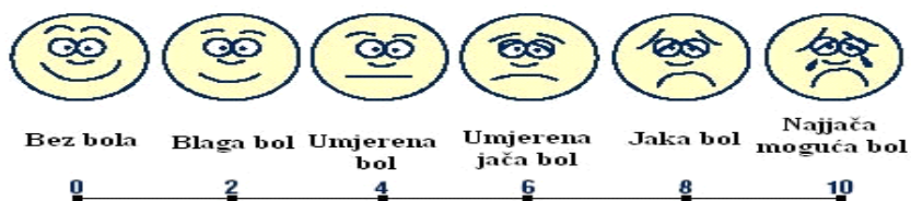
Skala za određivanje jačine bola

Psihička oboljenja bolesnika sprečavaju da se pravilno izrazi riječima, ali zato na vizualno-analognj skali jasno pokazuje stupanj boli, usprkos kognitivnom oštećenju ili uznemirenosti.