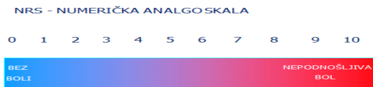
Slika 4.2.b Numerička ljestvica za procjenu boli

Potom se koristi numerička ljestvica (Numeric Rating Scale – NRS).