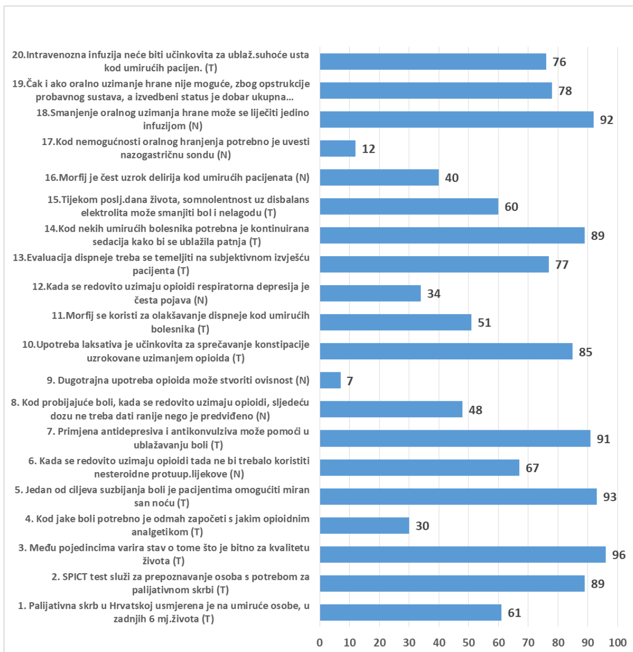
Grafikon 6.1.2: Postotak točnih odgovora medicinskih djelatnika na pojedinačna pitanja o poznavanju palijativne skrbi (n=100). Napomena: T = točna izjava, N = netočna izjava.