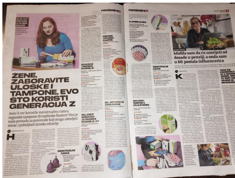
Slika 4.1.3.1. Primjer naslova u tiskanom izdanju N2