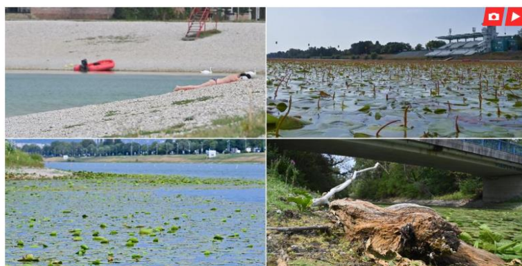
3.2.1.1. Prva objavljena novinarska tema