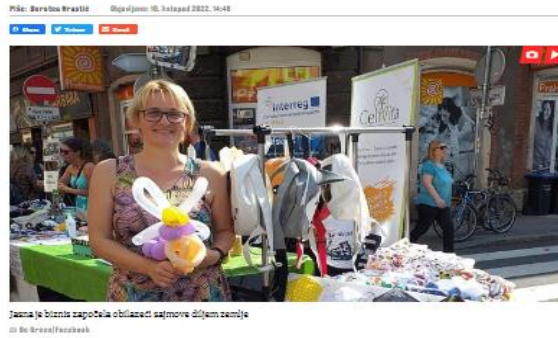
Slika 6.1.1.1. Primjer uredničke intervencije u naslovu i ilustraciji

Nadalje, primjer uredničke intervencije u naslovu vidljiv je u tekstu o refundaciji troškova HZZO-a. Iako Jutarnji list nema praksu da novinari-početnici opremaju tekst, jer će urednici ionako izmijeniti opremu, u početku se predlagao naslov. Tako je za ovaj primjer prvi naslov bio „HZZO nudi povrat troškova: 'Od plaćenih 1400 kuna za magnetsku rezonancu, vraćeno mi je 700 kuna““, no kada je jedan od urednika pripremao opremu teksta, naslov je „otišao“ u smjeru promoviranja HZZO-a, odnosno poprimio elemente PR naslova: „Pregled je hitan, a naručeni ste tek za 2026.? Ako odete privatniku HZZO pokriva troškove, evo kako do novca“. 15 Prema mišljenju Tomislava Novaka, ovaj naslov napravljen je za klikabilnost , što je potvrđeno i brojkama: u jednom danu tekst je pregledan više od 160.000 puta.