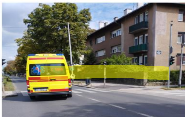
Slika 4.3.4. Tekst nakon uredničke intervencije

Promet se zaustavlja, a nakon nekoliko minuta deranjave i psovanja putnik baca svoja pomagala za hodanje na vozačicu ZET-a. Stiže i hitna pomoć i policija, a putnik je nakon toga pregledan i otpremljen u bolnicu.