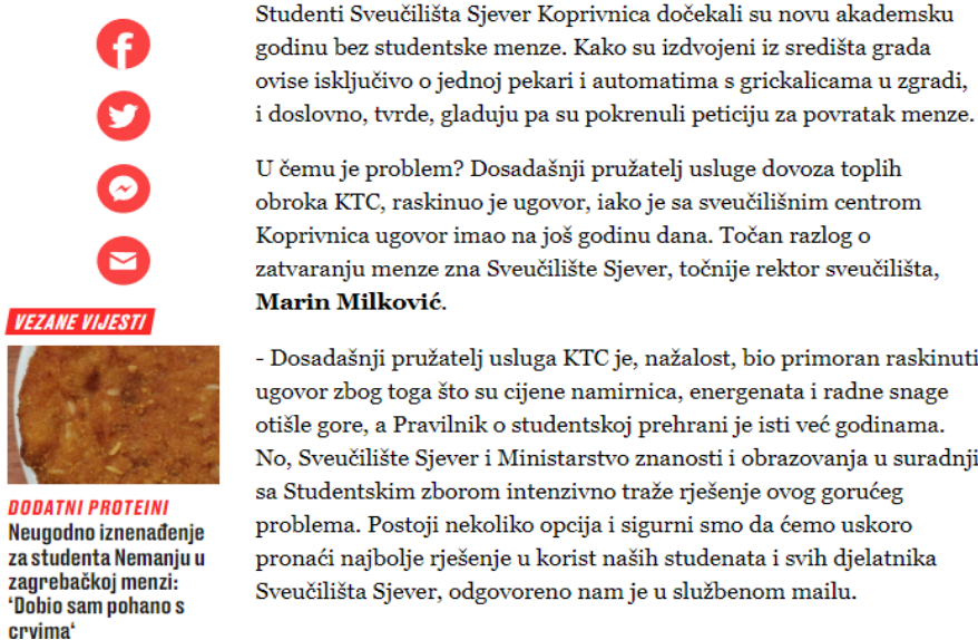
Slika 4.2.2. Primjer leada nakon ulaska u redakciju

Kako svaki od nadređenih urednika ima vlastiti stil, tako i novinari imaju svoj stil pisanja, međutim nikada nije dobro kada na jednom tekstu rade dva urednika, pregledavaju ga i puštaju u objavu, jer dolazi do nekoliko uredničkih intervencija u leadu zbog međusobnog neslaganja. Tako je primjer već naveden kod uredničke intervencije u naslovima, s refundacijom troškova HZZO-