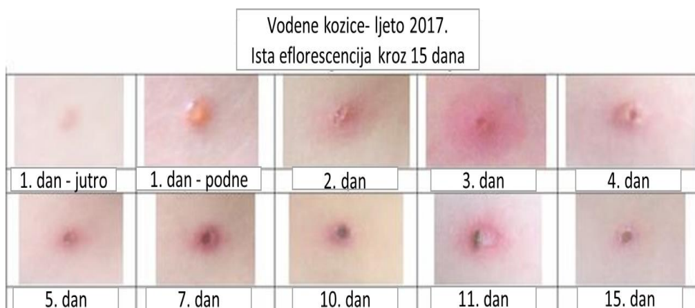
Slika 2.3.1. Razvoj eflorescencija vodenih kozica.

sustava, genitalijama, uretri i na konjunktivama [3]. Osip vodenih kozica započinje pojavom sitnih makula/mrlja, one se brzo razvijaju u papule/čvoriće, potom slijede vezikule/mjehurići ispunjeni tekućinom, pa pustule/gnojni mjehurići i na kraju postaju kruste/skule koje otpadaju [4]. Razvojna dinamika osipa brzog je tjeka te tijekom nekoliko sati prelazi iz makule do tipične vezikule udubljenog vrha nalik na kap rose. Vezikule nakon nekoliko dana postaju pustule koje se brzo suše i pretvaraju se u kraste. Vezikule koje se nalaze na sluznicama brzo pucaju i postaju afte. Opisani razvitak svake eflorescencije od makule do kruste traje oko četiri dana [2]. Slika 2.3.1 prikazuje razvoj iste eflorescencije kroz 15 dana.