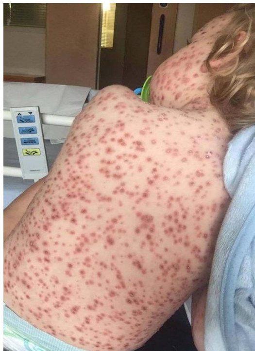
Slika 2.5.1. Varicelozna purpura

Primarne komplikacije koje uzrokuje sam VZV su rijetke, a javljaju se u obliku encefalitisa, pneumonije, miokarditisa, perikarditisa i hepatitisa. Do razvoja spomenutih komplikacija dolazi zbog toga što VZV ima afinitet na određene organe i sustave kao što su pluća, kože, jetra, krvožilni sustav i SŽS. Kod djece najčešća komplikacija vodenih kozica koja se može razviti je cerebralna ataksija. Cerebralna ataksija je benigna komplikacija neurološkog sustava koja se manifestira nemogućnošću koordinacije i izvođenja voljnih pokreta. Cerebralna ataksija prolazi spontano i ne zahtjeva liječenje te ne ostavlja posljedice za zdravlje. Teška komplikacija koja se vrlo rijetko javlja je varicelozna purpura karakterizirana trombocitopenijom i diseminiranom intravaskularnom koagulacijom (DIK) [3]. Slika 2.5.1. Prikazuje variceloznu purpuru.