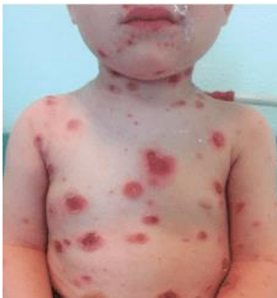
Slika 2.5.2. Impetigo kao komplikacija vodenih kozica

skarlatina zbog infekcije toksičnim sojem piogenog streptokoka (BHS-A) [3, 20]. Slika 2.5.2. prikazuje komplikaciju vodenih kozica impetigo.