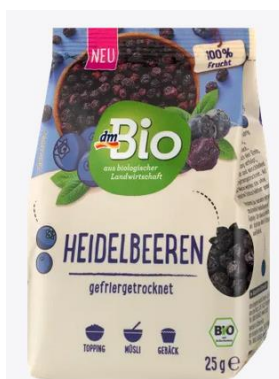
Slika 8. Osušene ekološke borovnice, izvor: https://www.dm.hr/dmbio-susene-borovnice-p4066447366891.html

Veliki nedostatak kod obrade borovnica u industriji predstavlja primjena topline, izloženost kisiku i upotreba enzima koji uzrokuju značajne gubitke bioaktivnih spojeva, osobito antocijana. Borovnice se mogu osušiti (Slika 8), no kod sušenja vrućim zrakom dolazi do gubitka znatnih količina antocijana. Sušenjem na temperaturi od 70 °C dolazi do gubitka oko 30% antocijana iz borovnica [21,30].