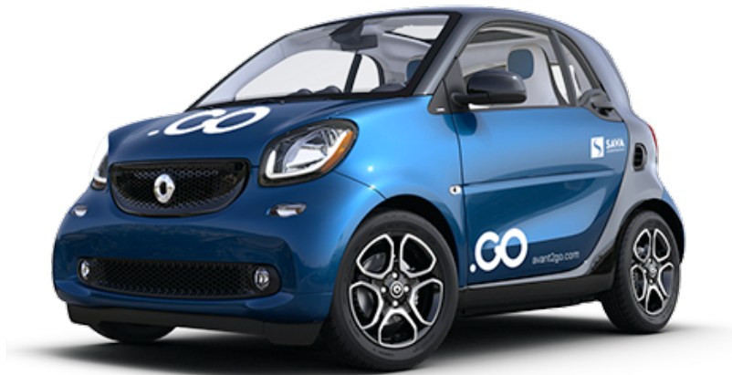
Slika 4. Avantcar

Poslovni modeli carsharinga se razvijaju i prilagođavaju novim tehnologijama i trendovima u industriji, uključujući integraciju s drugim oblicima prijevoza, poput bicikala i javnog prijevoza, te integraciju s uslugama za podjelu vožnje, kao što je UberPOOL.