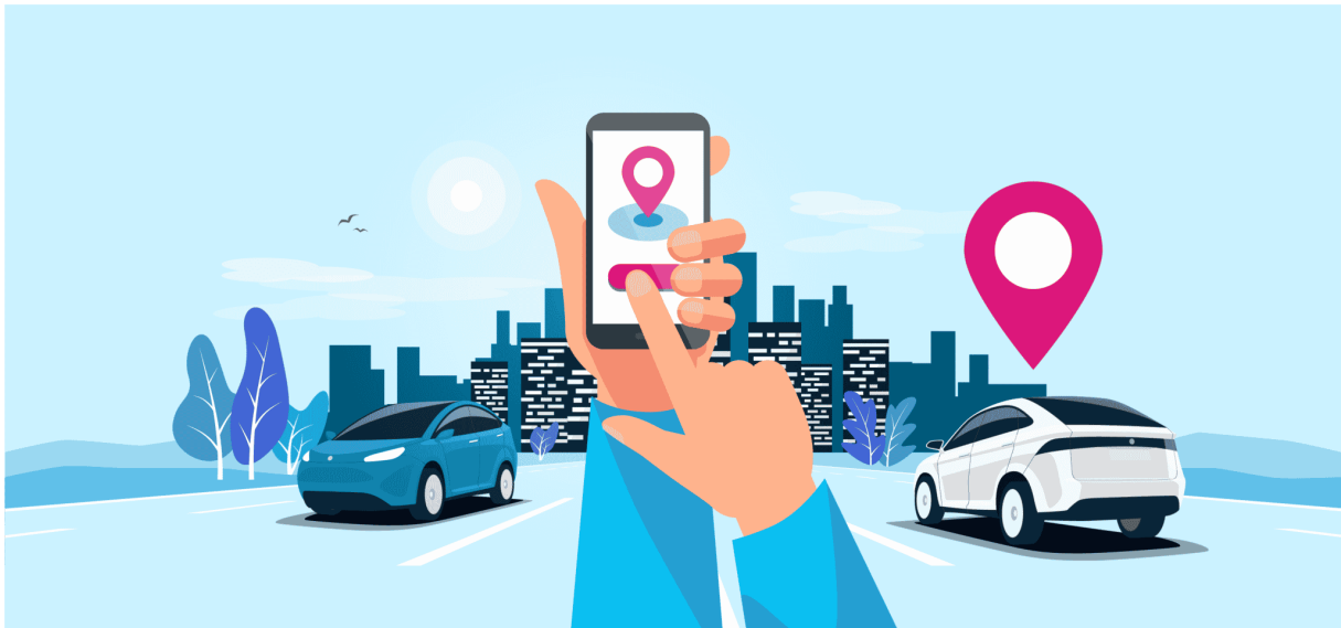
Slika 1. Carsharing

Carsharing je oblik dijeljenja automobila u kojem se više ljudi koristi istim vozilom u određenom vremenskom razdoblju. Carsharing se često organizira preko posebnih platformi koje omogućuju ljudima da iznajme automobil na sat, dan ili duže razdoblje, bez potrebe za dugotrajnim najmom ili kupovinom automobila. Korisnici obično rezerviraju vozilo preko interneta ili mobilne aplikacije i mogu ga preuzeti na određenoj lokaciji, a nakon korištenja vratiti na isto mjesto ili na drugo dogovoreno mjesto. Carsharing omogućuje ljudima da se kreću na fleksibilan i ekonomičan način, bez obaveza održavanja vlastitog automobila, smanjujući tako troškove i negativni utjecaj automobila na okoliš.