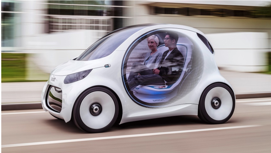
Slika 6. Smartov koncept samovozaćeg koncepta

Ipak, prije nego što se samovozeći automobili mogu koristiti u carsharing sustavima, potrebno je riješiti mnoga tehnička i sigurnosna pitanja, uključujući i pitanja osiguranja i odgovornosti u slučaju nesreća. Također će biti potrebno donijeti nove zakone i regulative kojima će se urediti korištenje samovozećih automobila u carsharing sustavima.