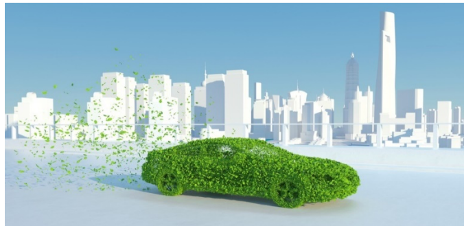
Slika 2. Carsharing i okoliš

U konačnici, utjecaj carsharinga na okoliš ovisi o mnogim čimbenicima, uključujući sastav flote vozila, način vožnje, korištenje obnovljive energije i utjecaj na druge oblike prijevoza. Potrebno je voditi računa o tim faktorima kako bi se osiguralo da carsharing ima pozitivan utjecaj na okoliš i da pridonosi održivom razvoju prometa.