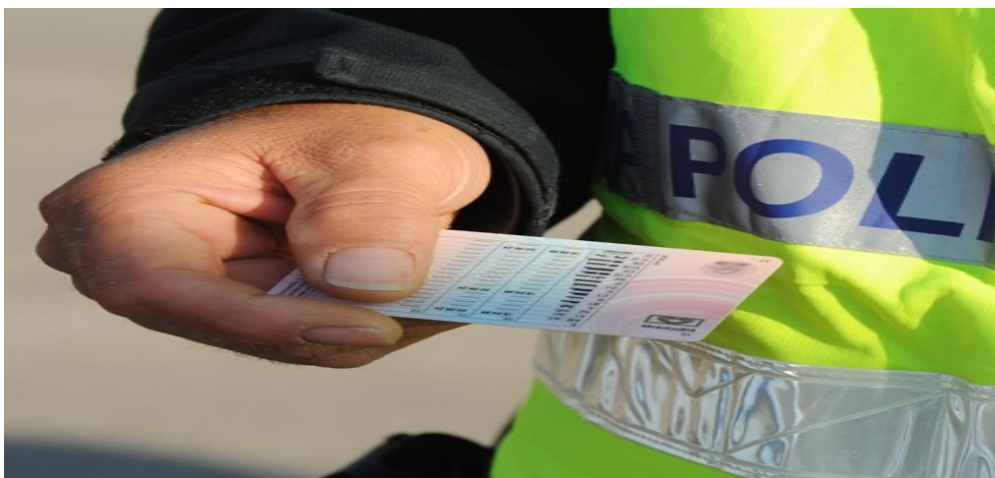
Slika 5. Policijska kontrola

Pravilnik o uvjetima, načinu i postupku pružanja javnog linijskog prijevoza putnika u cestovnom prometu - U Hrvatskoj, carsharing tvrtke koje pružaju javni prijevoz putnika moraju zadovoljiti uvjete navedene u Pravilniku o uvjetima, načinu i postupku pružanja javnog linijskog prijevoza putnika u cestovnom prometu.