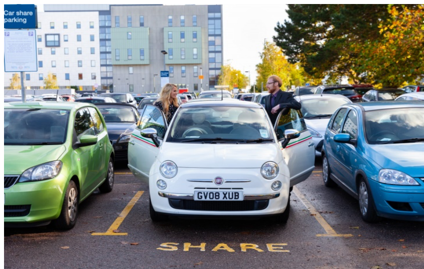
Slika 3. Carsharing i okoliš