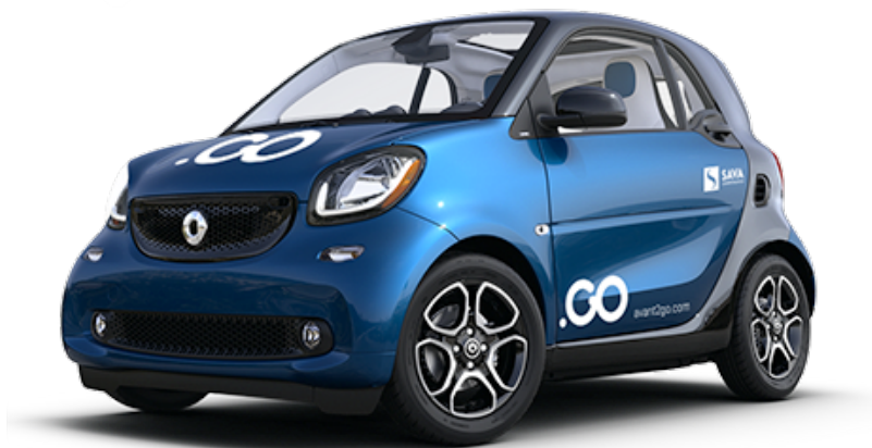
Slika 4. Avantcar

Poslovni modeli carsharinga se razvijaju i prilagođavaju novim tehnologijama i trendovima u industriji, uključujući integraciju s drugim oblicima prijevoza, poput bicikala i javnog prijevoza, te integraciju s uslugama za podjelu vožnje, kao što je UberPOOL.