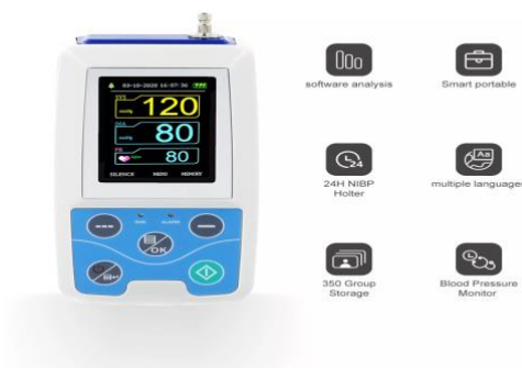
Slika 6.1.1. Prikaz 24 – satnog tlakomjera