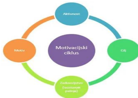
Slika 4.7.1. Prikaz motivacijskog ciklusa

Činjenica je da unatoč širokoj edukaciji i naglašavanju važnosti suzbijanja ovakvog načina života, društvo svjesno ili nesvjesno prihvaća isti čak i onda kada im je nužno da promijene određene navike. Iza svakog ponašanja pojedinca postoji potreba koju on takvim ponašanjem zadovoljava. Potrebe često prelaze u navike, a štetne navike kroz određeni vremenski period, često u čimbenike za razvoj bolesti. Ovdje kod štetnih navika, masovni prostor zauzimaju konzumacija alkohola i pušenje, te prihvaćanja takvih oblika negativnog ponašanja. Osobito su njima izložene adolescentske skupine koje još nisu razvile svoj stav i podložne su utjecaju društva. Kod istih tada dolazi do zadovoljavanja potrebe prihvaćanja u društvu. Mlađe populacije su često izložene manjku želje i motivacije, tj. skloniji su ponašanjima koja za njih proizvode korisne učinke. Ne prepoznaju korisne učinke sportskih aktivnosti kao zdravstvene dobrobiti. Svako ponašanje je rezultat upravo motivacijskog ciklusa, Slika 4.7.1. Ciklus se sastoji od određenih faktora i svaki od njih se može protumačiti kao prepreka pojedincu [36].