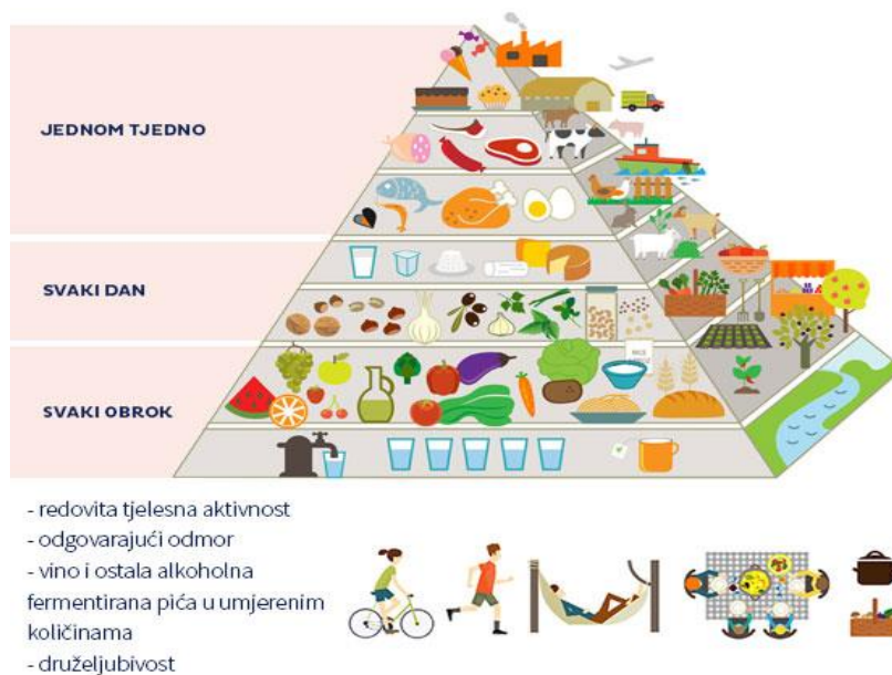
Slika 4.3.1.1. Piramida mediteranske prehrane

izvor masti); svježe sezonsko voće koje se konzumira kao desert; redovita konzumacija orašastih plodova i sjemenki (bilo kao dio recepata ili kao zdravi međuobroci); konzumacija mahunarki nekoliko puta tjedno; cjelovite žitarice dnevno; konzumacija umjerenih porcija ribe dva do tri puta tjedno; mliječni proizvodi (jogurt, mlijeko, sir) nekoliko puta tjedno u ograničenim količinama; začini i bilje za okus recepata; rijetko konzumiranje slatkiša (nekoliko puta tjedno); uključivanje crvenog i prerađenog mesa s najvećom umjerenošću u malim količinama; tri do četiri jaja tjedno; koristite puno vode kao piće; pijenje vina umjereno [27]. Piramida mediteranske prehrane sa svim preporučenim namirnicama prikazana je na Slici 4.3.1.1.