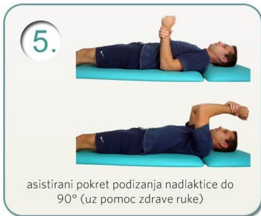
Slika 5.2.5. Podizanje bolesne ruke