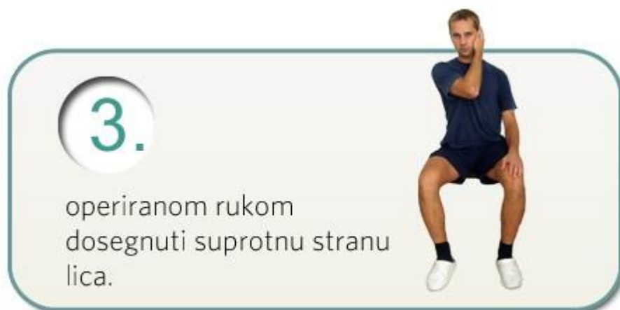
Slika 5.2.3. Vježba za održavanje higijene

Operiranu ruku dozvoljeno je koristiti ispod razine ramena s nadlakticom uz tijelo. Pacijent je u sjedećem položaju te suprotnom rukom (operiranom) pokušava dosegnuti nos, bradu, čelo i suprotno uho. Ova vježba će pomoći kod obavljanja higijene (Slika 5.2.3.) [25].