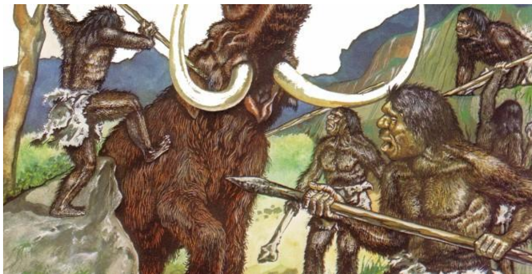
Slika 2.2.1. Lov ljudi u prapovijesti

Djeca su uvijek uključivala neke sportske, tjelesni aktivnosti u svoju igru čak i u ta najranija doba, ali točan datum ili točno vrijeme kada se sport počeo gledati kroz aspekte natjecanja ne znamo [6].