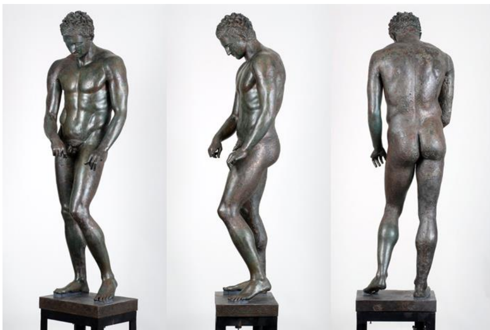
Slika 2.2.1.2. Hrvatski Apoksiomen

prije Krista kada su dobile rezultatski značaj, odnosno počeo se proglašavati pobjednik. Održavale su se svake 4 godine, a razdoblje između održavanja nazivalo se olimpijadom [8].