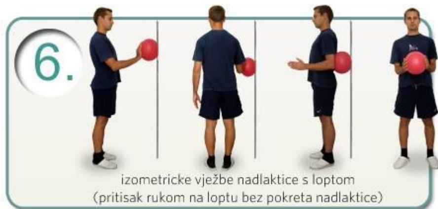
Slika 5.2.6. Izometričke vježbe nadlaktice s loptom

Izometričke vježbe služe za održavanje muskulature te kod njihovog izvođenja dužina mišića ne mijenja, međutim mijenja raste mišićni tonus. Sljedeća slika prikazat će nam vježbe sa loptom koje su često viđene u ustanovama za rehabilitaciju. Radi se pritisak na loptu snage 30-40 % da bi potaknuli mišićnu kontrakciju bez pokreta (Slika 5.2.6.) [25].