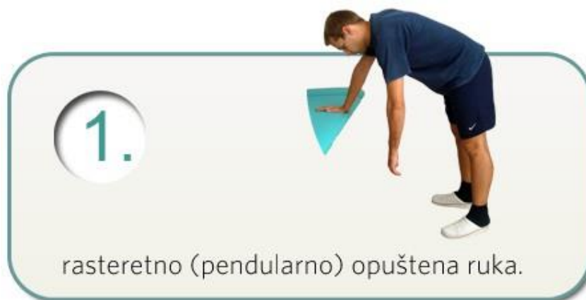
Slika 5.2.1. Pendularne vježbe

Najčešće ozljede osoba s invaliditetom koji su u kolicima je istegnuće mišića gornjih ekstremiteta te istegnuće mišića leđa. Kod ekipnih sportova koji se igraju rukom kao što su rukomet, košarka i odbojka najčešće dolazi do ozljeda ramena (istegnuće i iščašenje) te prijelomi prstiju i metakarpalnih kostiju. Ozljede istegnuća natkoljениčnih mišića, distorzije i luksacije skočnih zglobova te puknuće ligamenta koljena. Nabrojane vrste ozljede u raznim sportovima mogu nastati na razne načine kao što su padovi, nagli pokreti i sudaranje s drugim sportašima. Kod korištenja sportskih rekvizita može doći do žuljeva. Korištenjem steznika, bandažiranjem, zagrijavanjem, istezanjem i korištenjem zaštitne opreme smanjujemo rizik nastanka ozljeda [24]. Kod ozljede ramena gdje je došlo do ozljede mišića rotatorne manžete počinje se pendularnim vježbama u početku bez opterećenja te kasnije korištenjem utega (Slika 5.2.1.) [25].