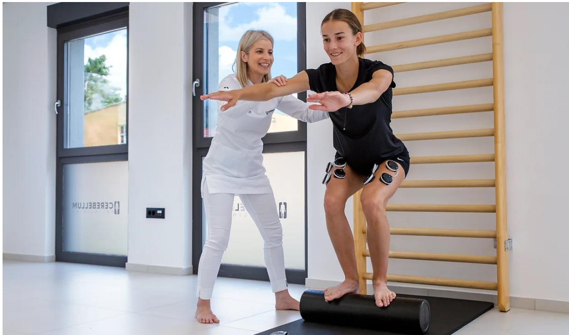
Slika 5.1.1. Individualni pristup kod rehabilitacije

ozljeda. U današnje vrijeme svaki ozbiljan klub ili pojedinac u sportu ima svog osobnog fizioterapeuta [24].