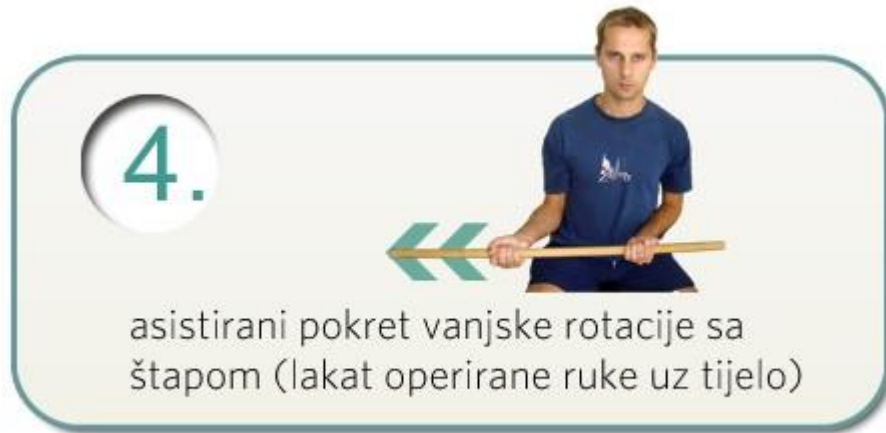
Slika 5.2.4. Vanjska rotacija

Pacijent je u sjedećem položaju te u rukama ima štap gdje su dlanovi pokrenuti prema gore, podlaktica saviti pod pravim kutom. Zdravom rukom gurati štap u smjeru bolesne ruke tako da nadlaktica tj. lakat bolesne ruke bude uz tijelo. Vježba se radi do boli (Slika 5.2.4) [25].