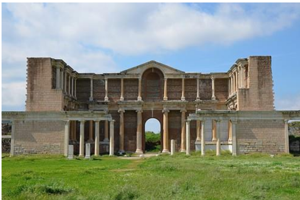
Slika 2.2.1.1. Ostaci Atenskog Gimnazija