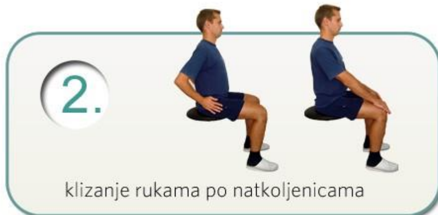
Slika 5.2.2. Istezanje ruke

Za istezanje ruke iskoristiti ćemo sjedeći položaj u kojem su ruke na kukovima te klizu prema koljenima (Slika 5.2.2.) [25].