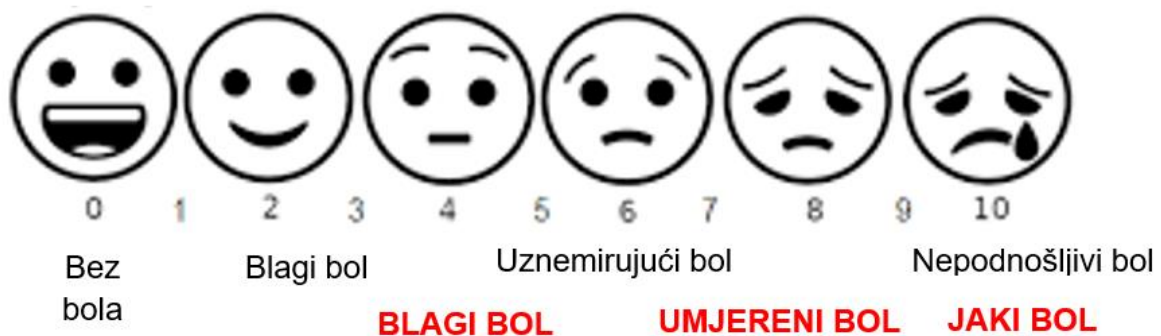
Slika 3.1.2.1 Vizualno analogna skala bola – VAS

Rezultati se temelje na samoprijavljenim mjerama simptoma koji se evidentiraju oznakom postavljenom u jednoj točki duž dužine linije od 10 cm koja predstavlja kontinuum između dva kraja ljestvice - „bez bola“ na lijevoj strani kraju (0 cm) ljestvice i „najgori bol“ na desnom kraju ljestvice (10 cm) (slika 3.1.2.1) [19].