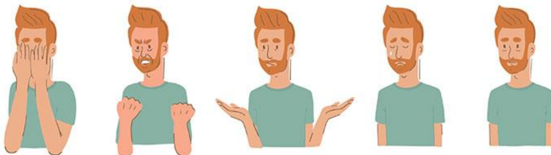
Slika 3.5.1.: Pet faza žalovanja prema modelu Elisabeth Kübler-Ross