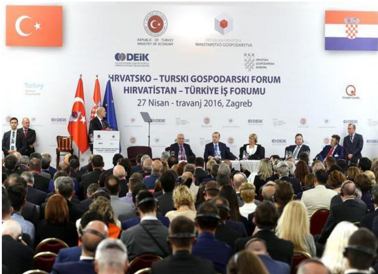
Slika 24. Hrvatsko-turski gospodarski forum