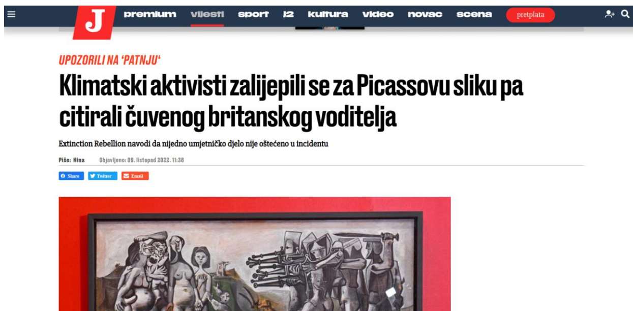
Slika 6: Primjer neutralne obojenosti naslova u Jutarnjem listu

Obojenost naslova kod tekstova vezanih za klimatski aktivizam mladih imala je najviše neutralnost čak 30 njih, 18 je imalo negativnu a šest pozitivnu obojenost. Kod tekstova vezanih za klimatski aktivizam mladih usmjerenog na uništavanje svjetske umjetničke baštine prisutno je pet negativnih obojenosti naslova i četiri neutralnih obojenosti naslova. S toga prikazujem primjer neutralne obojenosti naslov.