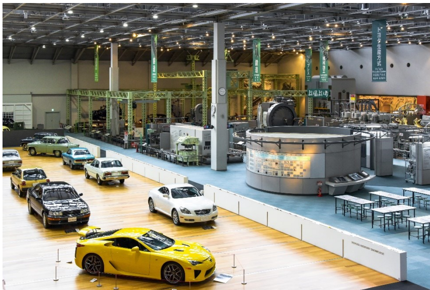
Slika 3. Toyota komemorativan muzej industrije i tehnologije ( https://www.japan.travel/en/spot/1234/ ; pristupljeno 04.08.2023.)

Automobile muzej te Fuji Motorsports muzej. Muzej Toyota Kaikan sadrži vođeni obilazak svjetski poznate proizvodne trake te pogled najnovijih modela i koncepata Toyota automobila. Toyota Kuragaike komemorativna dvorana omogućuje posjetiteljima upoznavanje s transformacijama automobilske tehnologije u zgradi iz vremena i mjesta gdje je nastala Toyota grupa. Spomen kuća Sakichi Toyoda prikazuje život osnivača ove tvrtke od njegovog rođena s prikazom njegove tradicionalne kuće sa slamnatim krovom. Toyota komemorativni muzej industrije i tehnologije vodi posjetitelje kroz potpunu povijest strojeva za tkanje i automobilskih tehnologija, uključujući i lako razumljive demonstracije sa stvarnim strojevima i živopisnim zaslonima, dok je Toyota Automobile muzej osnovan u spomen na povijest automobila i posvećen izgradnji prosperitetne budućnosti za ljude i automobile kroz sustavnu prezentaciju evolucije i kulture automobile iz cijelog svijeta, bez obzira na proizvođače te prikazuje sve od prvog automobila na benzinski pogon do modernih električnih automobila. Te posljednji muzej, Fuji Motorsports predstavlja uzbudljive povijesne događaje u moto-sportovima koji su razvili i potaknuli evoluciju automobila uz suradnju domaćih i inozemnih proizvođača automobila. (Toyota Motor Corporation, https://global.toyota/en/ )