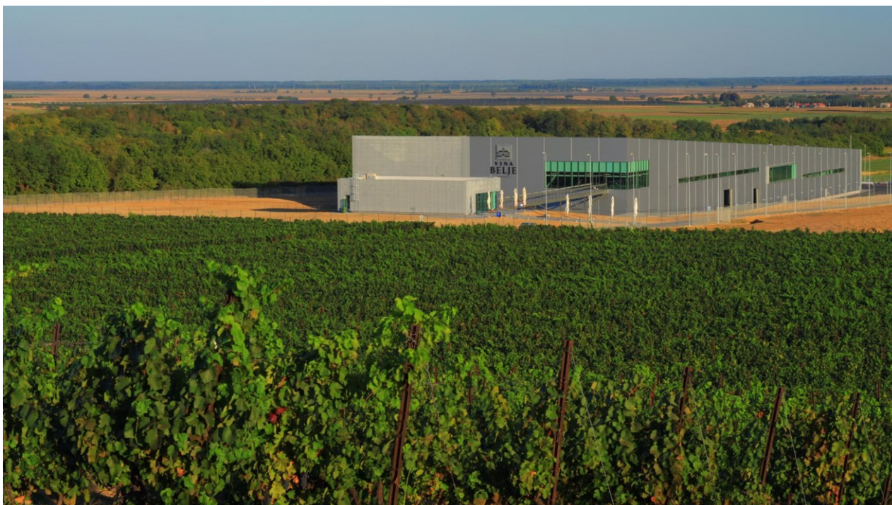
Slika 6. Vinarija na Banovom brdu, opremljena najnovijim tehnološkim dostignućima u proizvodnji vina ( https://shop.belje.hr/o-nama/ , pristupljeno 05.08.2023.)