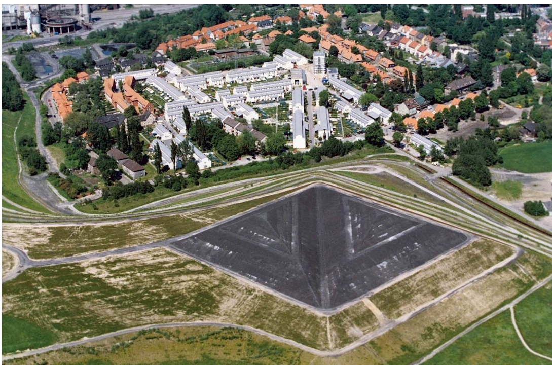
Slika 1. Pogled iz zraka na naselje Schüngelberg i odlagalište Rungenberg. Orijentir se sastoji od ruševinama prekrivenih dvostrukih piramida, 1998.