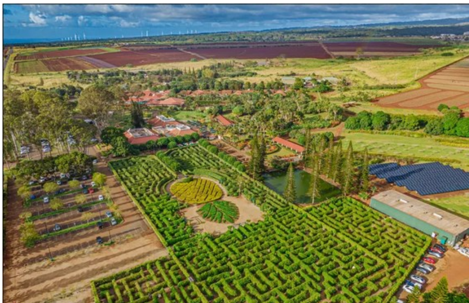
Slika 2. Pogled iz zraka na prostor plantaže Dole sa fokusom na labirint

Prvobitno korištena kao štand s voćem počevši od 1950., Plantaža Dole otvorena je za javnost kao havajski "Pineapple Experience" 1989. Danas je Plantaža Dole jedna od najpopularnijih atrakcija za posjetitelje Oahua i prima više od milijun posjetitelja godišnje. Plantaža Dole nudi ugodne aktivnosti za cijelu obitelj, uključujući obilazak Pineapple Express Train Tour, Plantation Garden Tour i Pineapple Garden Maze.