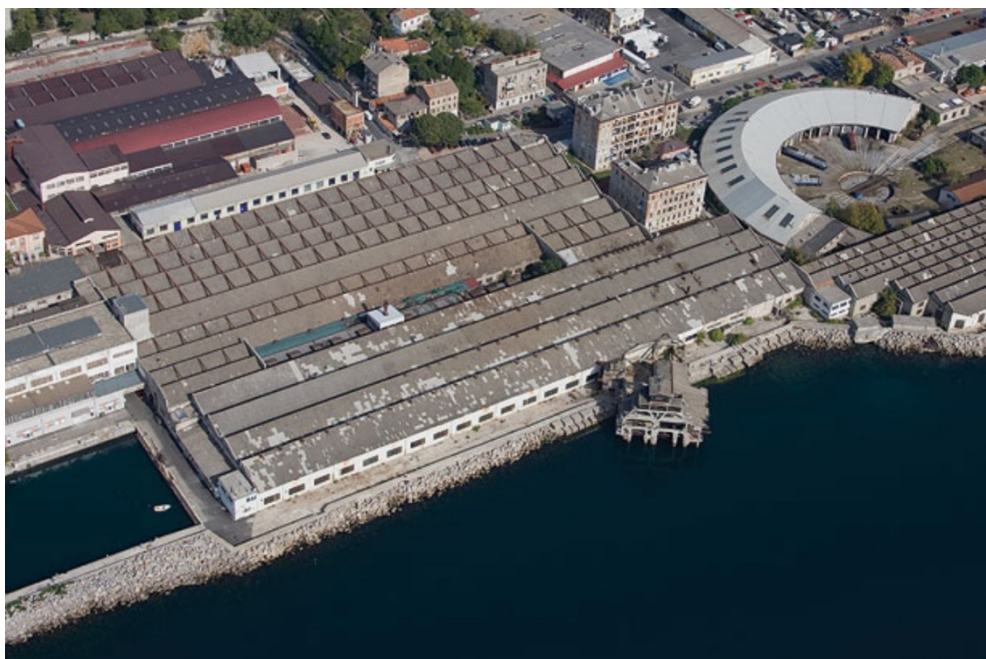
Slika 9. Zračni pogled na kompleks tvornice Torpedo