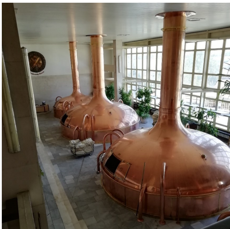
Slika 4. Peći za fermentaciju piva (slikano 25. lipnja 2019., autorski rad)

Jedna od poznatih čeških pivovara također nudi i razgled proizvodnog procesa alkoholnog pića jedinstvene recepture. Originalnog naziva "Český akciový pivovar" (češka dionička pivovara, danas Budějovický Budvar, n.p.), ova tvrtka počela je s proizvodnjom godine 1895. kao protest na većinski njemačko orijentiranoj Gradskoj pivovari češke države. Danas Budweiser poduzeće izvozi svoje pivo u 70 država svijeta, osvojilo je stotinjak nagrada diljem svijeta te budući da je u vlasništvu države, svaki stanovnik Češke Republike ima koristi od njihove zarade. Osim na usavršavanje kvalitete proizvodnje svojih proizvoda i širenje na nova tržišta, Budweiser je orijentiran i na privlačenje turista organiziranjem tura po svojim proizvodnim pogonima. Proces provođenja tura polazi od samog sustava kuhanja piva, testiranja, pregleda lager tankova te do linije punjenja staklenki, uz završnu postaju, suvenirnicu, u kojoj su dostupni jedinstveni proizvodi originalne proizvodnje; magneti, čaše, figurice, limited edition pivski proizvodi i slično. Vremenski okvir trajanja ture jest otprilike 60 minuta te je dostupna na češkom, engleskom, njemačkom, ruskom, francuskom, španjolskom i talijanskom jeziku. (Budweiser Brewery Tours; https://www.budejovickybudvar.cz/en/tours )