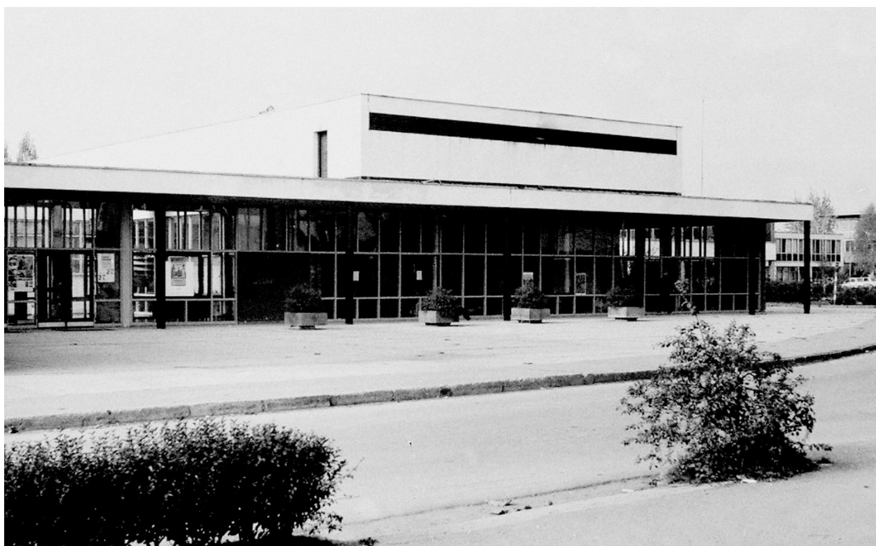
Slika 8. Knjižnica i kino dvorana godine 1965. iz zbirke Arhitektura u Ivanić-Gradu '60 – '85 ( https://industrijska-bastina.com/knjiznica-i-kino-dvorana/ ; pristupljeno 07.08.2023.)

Prvi istraživački radovi u ivanićkom kraju datiraju s početka 20. stoljeća. Inicijalna potraga za naftom rezultirala je pronalaskom prvih kapi nafte iz ovog kraja 1949. godine kada je u proizvodnju pušteno prvo od sedam naftnih polja koja djeluju na širem području Ivanić-Grada, polje Križ-Šumećani. Krajem 1962. godine otkriveno je, 3046 metara dubokom bušotinom, polje Ivanić te je u studenome 1963. godine počelo s radom cijelo naftno polje Ivanić. 60-tih i 70-tih godina osnivaju se brojne tvrtke na području grada: MEBA; kasnije Ivanićplast, Ivasim; kemijska industrija, TMPK; metaloprerađivačka industrija, ANTILOP; tekstilna industrija, 6.MAJ, kasnije Ivakarton, kartonaža, Agroposavina i brojne druge. Industrijalizacija je donosila napredak i blagostanje, gradile su se nove škole i vrtići, trgovački centri, upravna središta i industrijska postrojenja, u polu ruralnim sredinama dizale su se prve stambene zgrade modernih vizura. Ivanić-Grad je bio kolijevka izobrazbe radnih ljudi, raznih struka i razina, za potrebe cijelog nekadašnjeg INA-Naftaplina i drugih tvrtki koje su mijenjale gospodarski razvoj grada.