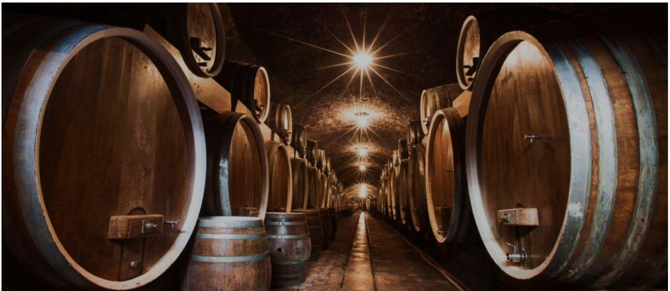
Slika 7. Prikaz tunela s vinskim bačvama u Iločkim podrumima