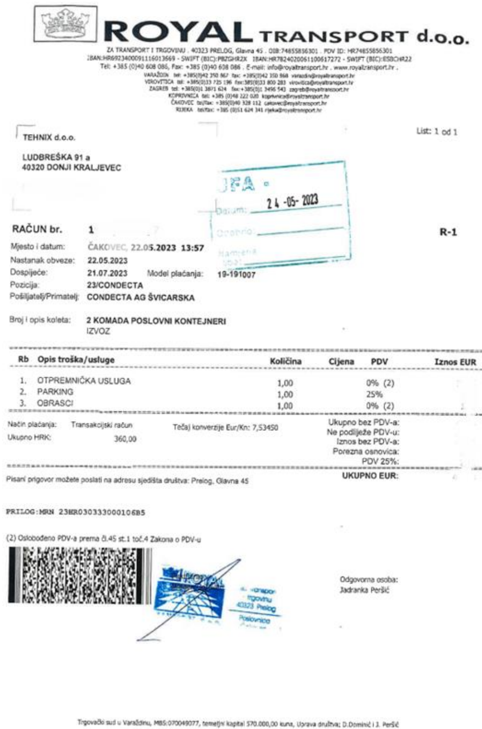
Slika 5.3 Račun