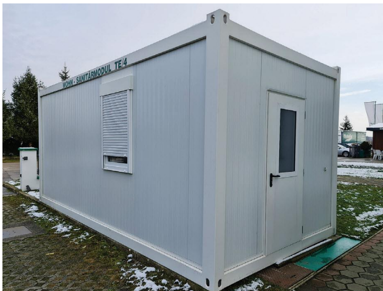
Slika 5.2 Sanitarni kontejner