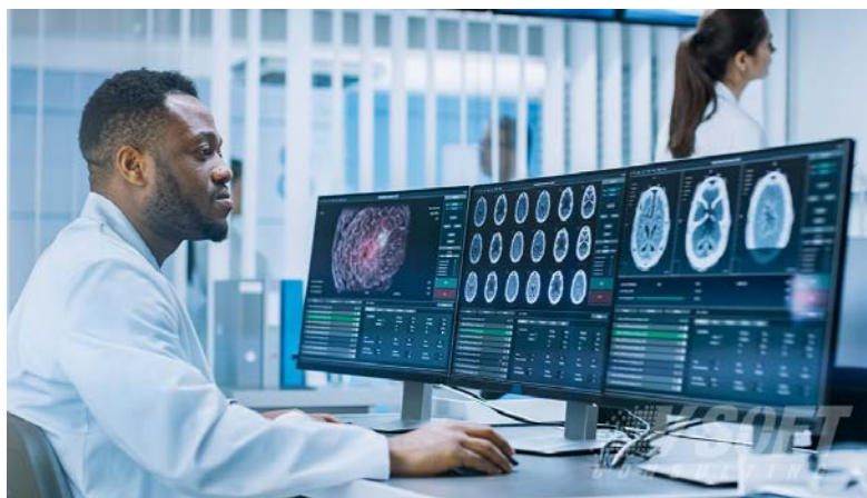
Slika 3. Primjena AI u zdravstvu