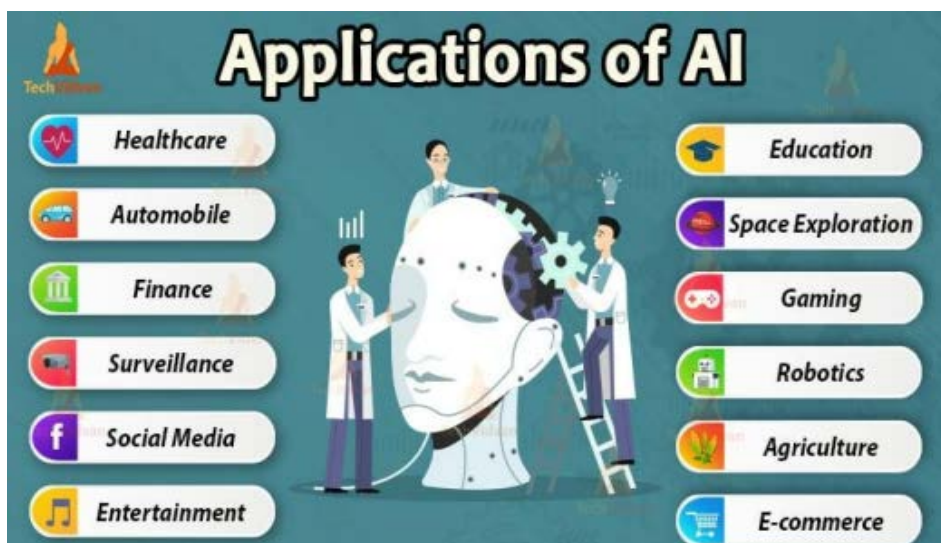
Slika 1. Umjetna inteligencija (AI) je alat koji se koristi u različitim industrijama radi donošenja boljih odluka, povećanja učinkovitosti i eliminacije ponavljajućeg rada.

„Umjetna inteligencija (AI) omogućuje strojevima modeliranje ili čak unapređivanje sposobnosti ljudskog uma. Umjetna inteligencija radi kombinirajući velike količine podataka s brzim, iterativnim procesiranjem i inteligentnim algoritmima, što omogućuje softveru da automatski uči iz obrazaca ili karakteristika u podacima. Algoritam za AI je prošireni podskup strojnog učenja koji računalu govori kako samostalno učiti raditi. S vremenom, uređaj nastavlja stjecati znanje kako bi poboljšao procese i izvodio zadatke učinkovitije od ljudskog inteligentnog razmišljanja.“ (Valavanidis, 2023).