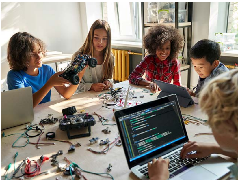
Slika 4. AI u obrazovnim uslugama

ocjenjivanje, može pomoći studentima u razvoju vještina i može se koristiti kao još jedan stvarni svjetski obrazovni alat. „AI programi mogu biti stvoreni kako bi pružali informacije, služili kao forum na kojem studenti postavljaju pitanja i uče činjenice ili pružali osnovne smjernice za nastavnika. AI, s druge strane, u ekstremnim situacijama može promijeniti ulogu nastavnika u ulogu facilitatora.“ (Staff, 2015).