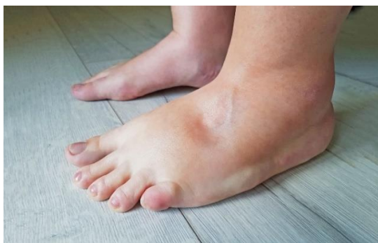
Slika 4.1.2. Edemi i uzroci

Nefrotski sindrom može se pojaviti kod osoba s anemijom srpastih stanica i evoluirati do zatajenja bubrega. Sindrom se javlja u bilo kojoj životnoj dobi, no ipak je nešto češći u djece nego u odraslih. U rane simptome nefrotskog sindroma pripadaju gubitak apetita, opća slabost, oteklina očnih kapaka, bolovi u trbuhu, gubi se mišićna masa te se javljaju edemi zbog zadržavanja viška soli i vode, a urin je zamućen. Trbuh može biti povećan ukoliko se nakuplja veća količina tekućine, a do nedostataka zraka može doći zbog nakupljanja tekućine oko pluća. Simptomi se javljaju postupno danima i tjednima uz konstantno pogoršanje stanja, a bolesnik gubi sve više proteina zbog oštećenih glomerula [9]. Nefrotski sindrom očituje se masivnom proteinurijom, koja iznosi ukupno 3,5 g ili više bjelančevina u razdoblju od 24h. Gubitak proteina, posebno albumina naziva se hipoalbuminemija, a zbog smanjenja osmotskog tlaka plazme nastaje generalizirani edem koji je vidljiv u svim dijelovima tijela [7]. Edemi su obično meki i tjestasti (Slika 4.1.) [7].