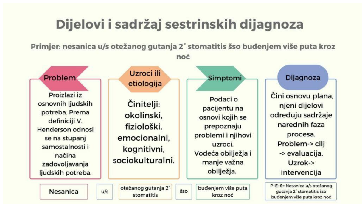
Slika 5.3.4. Dijelovi sestrinske dijagnoze

Slika 5.3.4. prikazuje dijelove i sadržaj sestrinskih dijagnoza. U nastavku slijedi nekoliko sestrinskih dijagnoza koje se mogu uočiti kod nefrotskog sindroma te uz svaku dijagnozu pripadajući rizični čimbenici, ciljevi, intervencije te evaluacija.