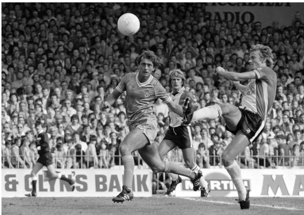
Slika 1. Počeci nogometa 1

U članku The history of soccer [3] spominje se da je prvi nogometni savez osnovan u Engleskoj 1863. godine, koji ujedno utemeljuje pravila koja su se nastavila mijenjati, dok su veličina i težina lopte postale standardizirane. Pravila nalažu da je zabranjeno nošenje lopte rukama, čime se jasno razdvajaju nogomet i ragbi kao dva odvojena sporta. Dvadeseto stoljeće donosi brz razvoj nogometa, što je potaknuto i industrijalizacijom. Dominaciju nad školskim ekipama preuzimaju klubovi sastavljeni iz tvorničkih ekipa. Novčane nagrade za najbolje igrače postaju uobičajene, a ulaznice za nogometne događaje postaju sve traženije, zbog čega se uvode i prve pretplate. Među gledateljima izdvajaju se pripadnici radničke klase.