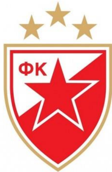
Slika 4. Grb Crvene zvezde 3