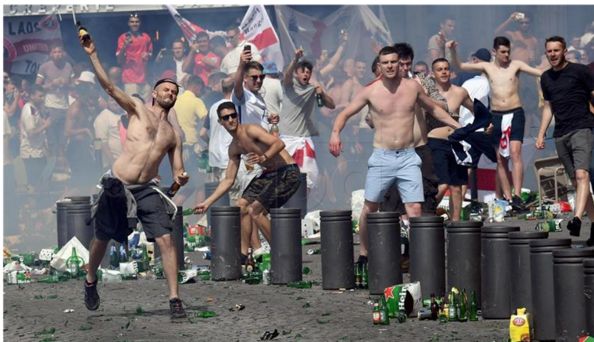
Slika 5. Navijački sukobi 4

izbjegavanju političkih stavova, deklarirali su se kao ekstremni srpski nacionalisti. U sezona 1990-91. kad je Zvezda postala europski prvak, Delije su je pratile klub na domaćim te svim gostovanjima, uključujući finale Kupa europskih prvaka u Bariju, gdje je prezentirana najveća nacionalna zastava ikada viđena na stadionima. Ubrzo nakon osvajanja trofeja započeo je rat u Jugoslaviji, gdje mnogi članovi Delija postaju dragovoljci u četničkim i ostalim paravojsnim skupinama. Srbija se ubrzo našla pod sankcija pa je Crvenoj zvezdi je bilo zabranjeno sudjelovanje u međunarodnim natjecanjima [12]. Nakon ukidanja sankcija, dolazi do fuzije nove i stare generacije Delija , a i danas djeluju pod sloganom „Zvezda je život, ostalo su sitnice“ [12].