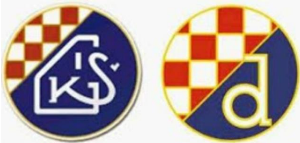
Slike 3. Logo Dinama nekada i sada