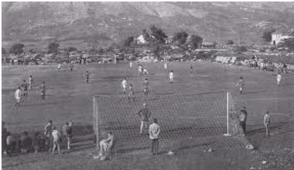
Slika 2. Počeci nogometa u Hrvatskoj 2

Članstvo HNS-a u organizaciji FIFA-i potječe od 1941. godine, no formalno je obnovljeno 3. srpnja 1992., nakon proglašenja samostalnosti Republike Hrvatske. HNS punopravnim članom UEFA-e postaje 17. lipnja 1993. godine.