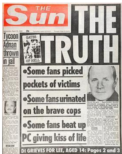
Slika 1 Naslovnica tabloida "The Sun" o tragediji o Hillsboroughu 4

Tragedija u Hillsboroughu dogodila se zbog brojnih organizacijskih propusta i pogrešaka od strane osiguranja i policije. Mediji su svoju krivnju prebacili na „pijane navijače bez ulaznica“, a tek je nakon 20 godina istina izašla na vidjelo. Zbog načina praćenja tog događaja navijači Liverpoola godinama su bojkotirali britanski tabloid The Sun. Taj je tabloid objavio naslovnicu pod naslovom „The Truth“ (Slika 1) gdje su okrivili navijače Liverpoola za tragediju i prekrili brojne organizacijske propuste i pogreške. Iako u stvarnosti u Hillsboroughu nije bilo riječi o huliganizmu, zbog tragičnog događaja u Heyselu prouzrokovanom od strane huligana nije bilo teško stvoriti pogrešnu sliku o nezapamćenoj tragediji. 3