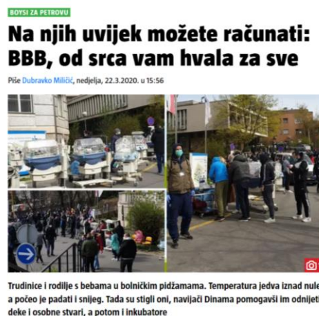
Slika 2 Pozitivan članak o navijačkim skupinama 8

S druge strane, 2023. godine mediji su prenosili članke o tim istim navijačima u sasvim drugačijem kontekstu (Slike 4 i 5). Dio navijača Dinama Zagreb je, okupljen pod nazivom Bad Blue Boys, unatoč zabrani odlaska na gostujuću utakmicu AEK – Dinamo u trećem pretkolu Lige prvaka ipak otišao u Atenu. Uoči tog susreta, tijekom sukoba s navijačima AEK-a jedan je domaći navijač izboden nožem te je od posljedica ranjavanja i preminuo. Hrvatski, grčki, ali i ostali mediji svakodnevno su izvještavali o tom događaju i razvoju situacije u negativnom kontekstu prebacivši krivnju na Bad Blue Boyse. Članci ispod naslova „Mediji prozivaju BBB-e zbog vrijeđanja nakon povratka iz Grčke: Prisjetimo se – prikazivali su ih kao zločince...“ (Slika 4) i „Dinamovi navijači pušteni iz grčkih zatvora vrijeđali snimateljske ekipe“ (Slika 5) prikazuju negativno praćenje događaja iz Atene od strane medija. Za razliku od primjera pozitivnog praćenja navijačkih skupina (pomoć nakon potresa u Zagrebu), mediji su, osim utakmice u Ateni pratili i navijačke sukobe.