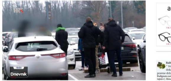
Slika 5 Negativna vijest o navijačima 11

Objavljeno 6 mjeseci prije - 10/12/2013 od Marjan T