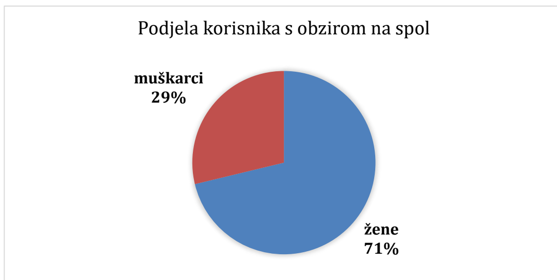
Grafikon 5.2.1. Prikaz broja korisnika s obzirom na spol

U grafikonu 5.2.1. prikazana je broj korisnika s obzirom na spol.