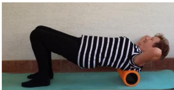
Slika 8.7.1. Prikaz relaksacije leđnih mišića