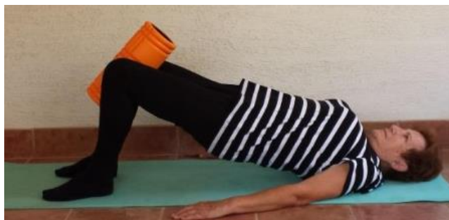
Slika 8.2.1. Podizanje kukova uz adukciju