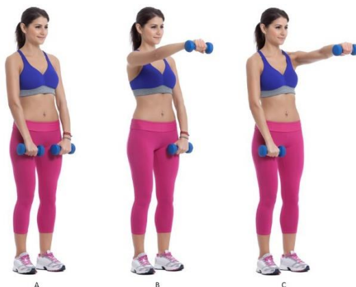
Slika 8.3.2. prikaz naizmjeničnog predručenja