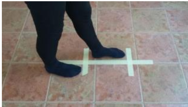
Slika 8.5.2. Prikaz vježbe pravilnog hoda

(Izvor: https://urn.nsk.hr/urn:nbn:hr:117:425218 )