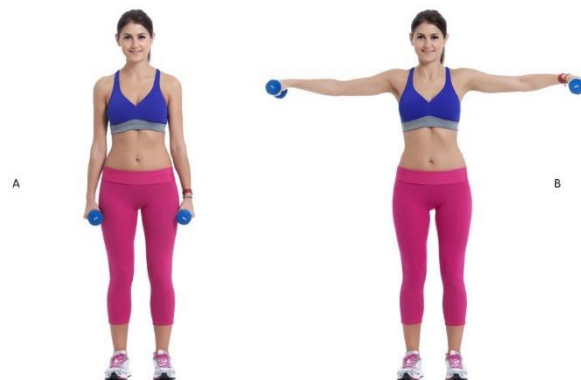
Slika 8.3.1. Prikaz vježbe odručenja