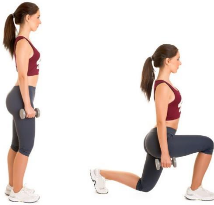
Slika 8.3.3. Prikaz naizmjeničnog prednjeg iskoraka