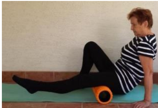
Slika 8.7.2. Prikaz relaksacije stražnjeg dijela natkoljenice