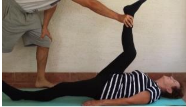
Slika 8.6.1. Prikaz istezanja stražnjeg dijela natkoljenice

(Izvor: https://urn.nsk.hr/urn:nbn:hr:117:425218 )