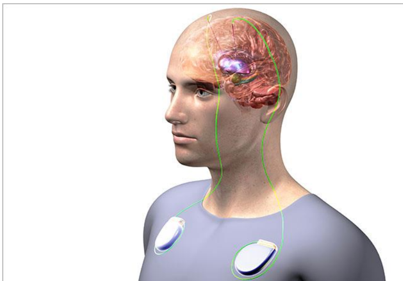
Slika 6.3.1. Prikaz duboke moždane stimulacije