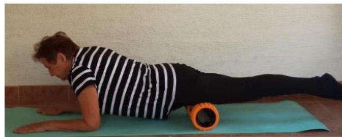
Slika 8.7.3. Prikaz relaksacije kvadricepsa