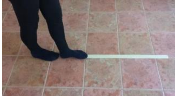
Slika 8.5.1. Prikaz hodanja po ravnoj liniji