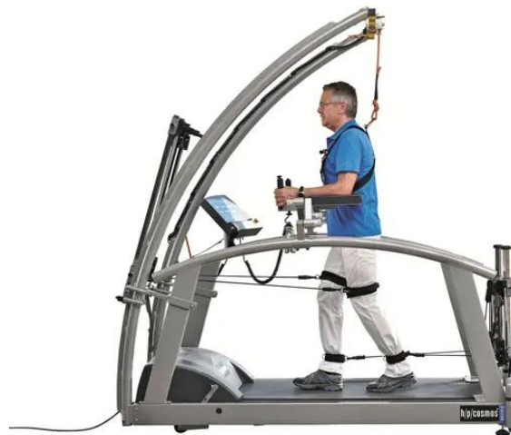
Slika 8.8.1. Prikaz trake za rehabilitaciju

pacijenata te je pokazala dobre rezultate kod pacijenata s PB koji imaju ugrađen DBS uređaj. 2014. godine istraživao je utjecaj protokola robotske rehabilitacije uz pomoć lokomata kod oboljelih od PB i ugrađenim DBS-om. Dokazan je pozitivan učinak na prostorno-vremenske parametre hoda, stoga se preporučuje kao dodatna terapija kod takvih pacijenata. Također, dokazano je da je trening hoda uz pomoć ritmične auditivne stimulacije u kombinaciji s konvencionalnom fizioterapijom poželjan alat kod unapređenja hoda. Jedna od novijih metoda koja se koristi za rehabilitaciju jest traka za trčanje. Dokazano je da trening na traci za trčanje s tjelesnim opterećenjem može doprinijeti mobilnosti donjih ekstremiteta te biti ciljana intervencija kod osoba oboljelih od PB s ugrađenim DBS-om. Koriste se trake za rehabilitaciju koje služe za trening i korekciju hoda kao što prikazuje slika 8.8.1. [25].