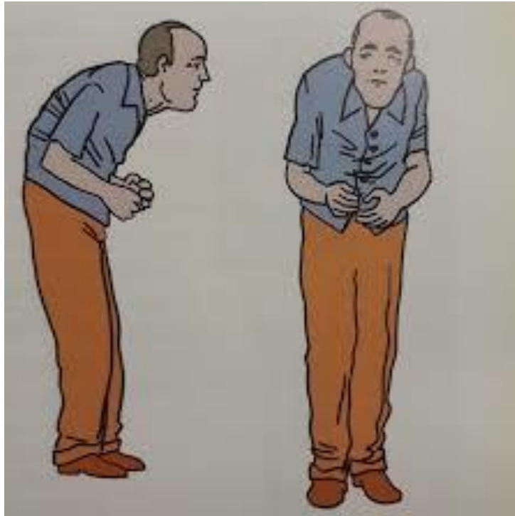
Slika 4.4.1 Prikaz držanja tijela kod PB

stolice iz čekaonice, osoba izgleda kao na slici 4.4.1. Naravno s time se ne može 100% potvrditi dijagnoza jer neka druga neurološka stanja mogu proizvesti hod sličan PB. Poremećaj hoda ne čini ranu značajku PB-a, no olakšava dijagnozu u kasnijim fazama [9,11].