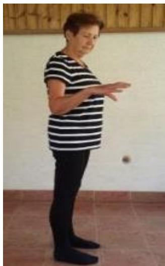
Slika 8.5.3. Prikaz odbijanja loptice o pod u stojećem položaju

(Izvor: https://urn.nsk.hr/urn:nbn:hr:117:425218 )