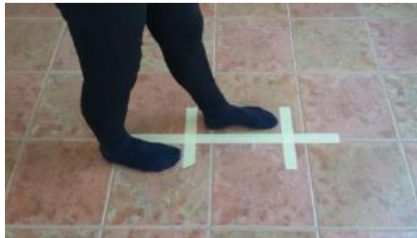
Slika 8.5.2. Prikaz vježbe pravilnog hoda

(Izvor: https://urn.nsk.hr/urn:nbn:hr:117:425218 )