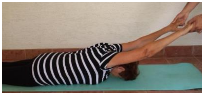
Slika 8.6.3. Prikaz istezanja ramenog obruča i leđa