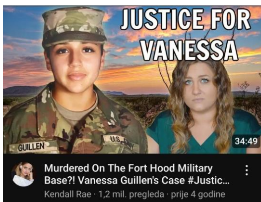
Slika 6.4.2. Primjer naslovne slike videozapisa Kendall Rae 21

priča o nestalim osobama i povremenih komentara o širim društvenim temama. Ono što se izdvaja jest njezina usredotočenost na podizanje svijesti o manje poznatim slučajevima i korištenje platforme za isticanje problema koji možda neće dobiti toliku pozornost važnijih novinarskih kanala ili portala. Svoju karijeru započela je 2.8.2012. godine kada je objavila videozapise s uputama kako se našminkati i slično, no nikad nije pomiješala različite teme. Kasnije je objavljivala videozapise na temu teorija zavjere i misterija. Godine 2017. počela je objavljivati videozapise o nestalim osobama. Među prvima je bio video o nestaloj djevojčici (Ashe Degree), koji sada „stoji“ na gotovo 1.5 milijuna pregleda. U prvih 30 sekundi videa Kendall spominje organizaciju „Thorn“, koja svojom inovativnom tehnologijom pokušava spasiti nestalu i iskorištavanu djecu. U videu koji traje 16 minuta uspije upoznati nove gledatelje s organizacijom koja pomaže ugroženoj djeci, pokušava dobiti donacije za spomenutu organizaciju i ukazati na tada ne tako poznat slučaj. U mnogim videima prikazuje članove obitelji žrtava kako bi im pružala platformu da govore o svojim voljenima, o procesu ili nekim problemima u istrazi. Neprestano se bori za pravdu i ne boji se ukazati na propuste koje su možda učinili policija, pravosudni sustav ili zakon. Njezini videozapisi ne samo da podižu svijest, već služe za edukaciju zajednice. Smatram stoga kako je jedan od podcijenjenih kanala s 3.82 milijuna pretplatnika.