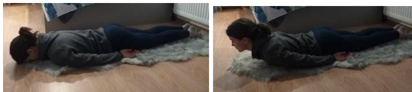
Slika 5.3.1.1 Primjer vježbe za jačanje ekstenzora trupa

Kod Rettovoga sindroma, vježbe jačanja fokusiraju se na mišiće ekstenzore trupa. Vježbe za jačanje mišića ekstenzora trupa sastoje se od nekoliko pokreta koji se izvode ležeći na trbuhu ili na boku, kao i u četveronožnomu ili klečećemu položaju. Svaka vježba se ponavlja deset puta. Primjer nekoliko vježbi: podizanje glave i gornjega dijela trupa ležeći na trbuhu s rukama uz tijelo i spojenim nogama, što prikazuje Slika 5.3.1.1. Slična vježba, ali rukama spojenima iza leđa. Podizanje glave i gornjega dijela trupa s rukama spojenima iza vrata. Podizanje glave i gornjega dijela trupa s dlanovima oslonjenima na strunjaču ispod ramena. Podizanje naizmjenično ispružene ruke i noge ležeći na trbuhu. Podizanje istovremeno ispruženih ruku i nogu ležeći na trbuhu. Podizanje naizmjenično ispružene noge ležeći na trbuhu. Podizanje glave i gornjega dijela trupa s dlanovima oslonjenima na strunjaču, zatim sjedenje na pete i povratak u potrbušni položaj. Ispravljanje jedne, pa druge ispružene noge u četveronožnomu položaju. Ispravljanje jedne ispružene ruke prema naprijed i jedne ispružene noge prema natrag, naizmjenično u četveronožnomu položaju [18].