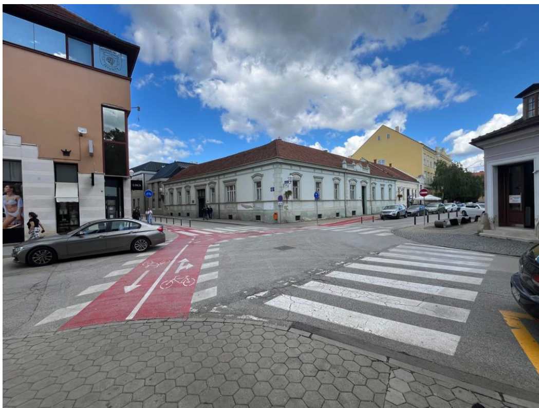
Slika 9. - Raskrižje Ulice Augusta Šenoje i Pavlinske ulice

Vrlo bitan izazov je i sigurnost na cestama. Na nekim dijelovima grada, kao što je raskrižje Ulice Augusta Šenoje i Pavlinske ulice, dolazi do velikog broja prometnih nesreća jer je raskrižje jako nepregledno i neprilagođeno, što predstavlja veliki rizik sudionicima u prometu.