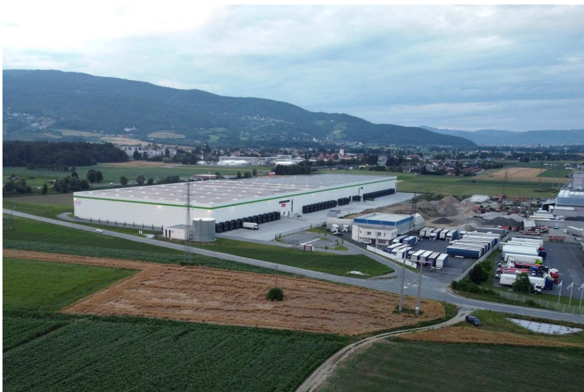
Slika 8. - Logistički centar u Mariboru

Zajednički rad gradske uprave, privatnih kompanija i drugih važnih sudionika od ključne je važnosti za Planove održive urbane mobilnosti. Osim što vlasti surađuju s tvrtkama za poboljšanje dostavnih uvjeta, važan aspekt je i poticanje održivog prijevoza za zaposlenike. Primjeri uključuju inicijative koje gradovi i tvrtke provode kako bi zaposlenike motivirali na korištenje bicikala, javnog prijevoza ili pješaćenja. Na primjer, neke tvrtke nude subvencije za javni prijevoz, organiziraju biciklističke kampanje ili nude infrastrukturu poput sigurnih parkirališta za bicikle. Ove mjere ne samo da smanjuju promet i emisije, već i poboljšavaju kvalitetu života i zdravlje građana, stvarajući održivije urbane sredine.