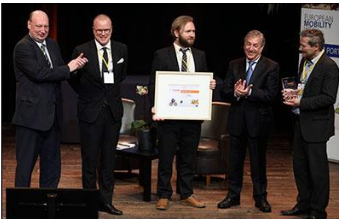
Slika 7. - Dodjela nagrade za održivu urbanu mobilnost

Malmo je uveo neke nove metode za analizu prometa i razvoja, uključujući Poly-SUMP, Policentrični Plan održive urbane mobilnosti, pomoću kojeg se u obzir uzima više urbanih sredina, a ne samo jedan središnji dio grada. Činjenica da je grad nagrađen za svoje uspjehe potvrđuje visoke standarde upravljanja i predanosti održivosti. Malmo je jako dobar primjer gradovima koji žele postići održivi razvoj i omogućiti ljudima kvalitetniji život.