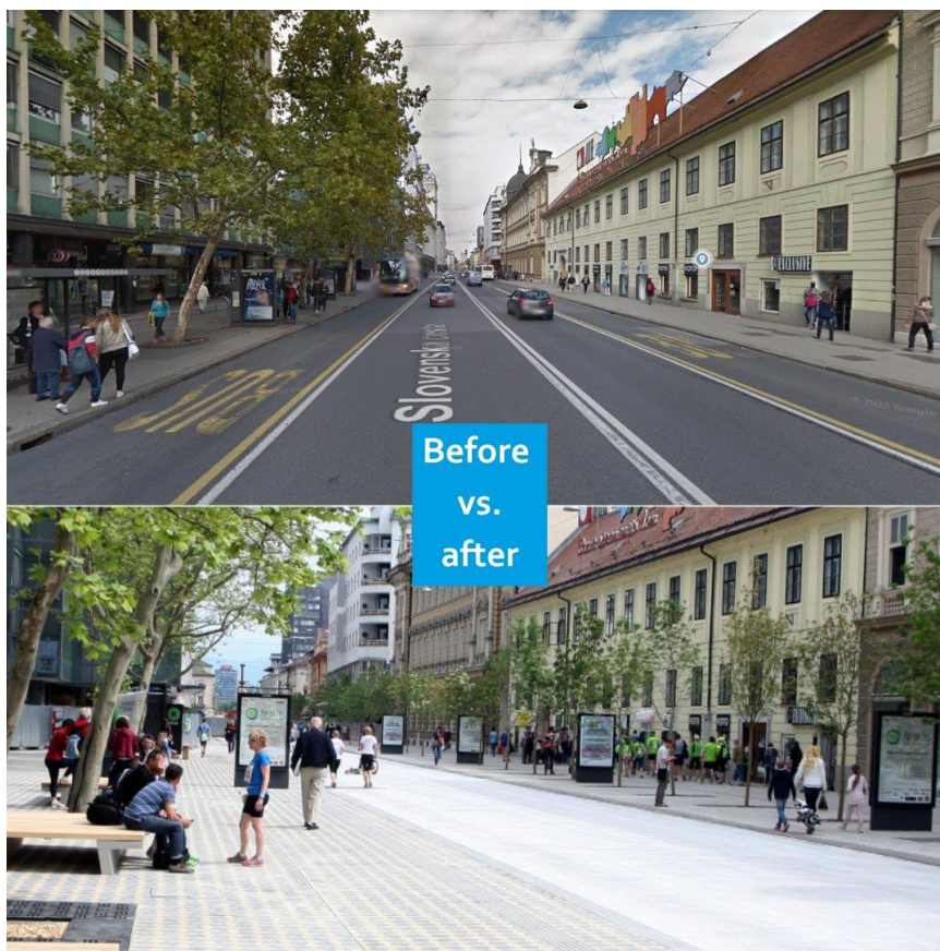
Slika 5. - Cetar Ljubljane prije i poslije zone bez automobila