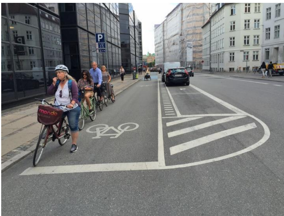
Slika 3. - Biciklistička staza u Kopenhagenu

"Razgranata pješačka mreža Kopenhagena obuhvaća više od 33.000 m 2 ulica i 66.000 m 2 trgova. " [5]