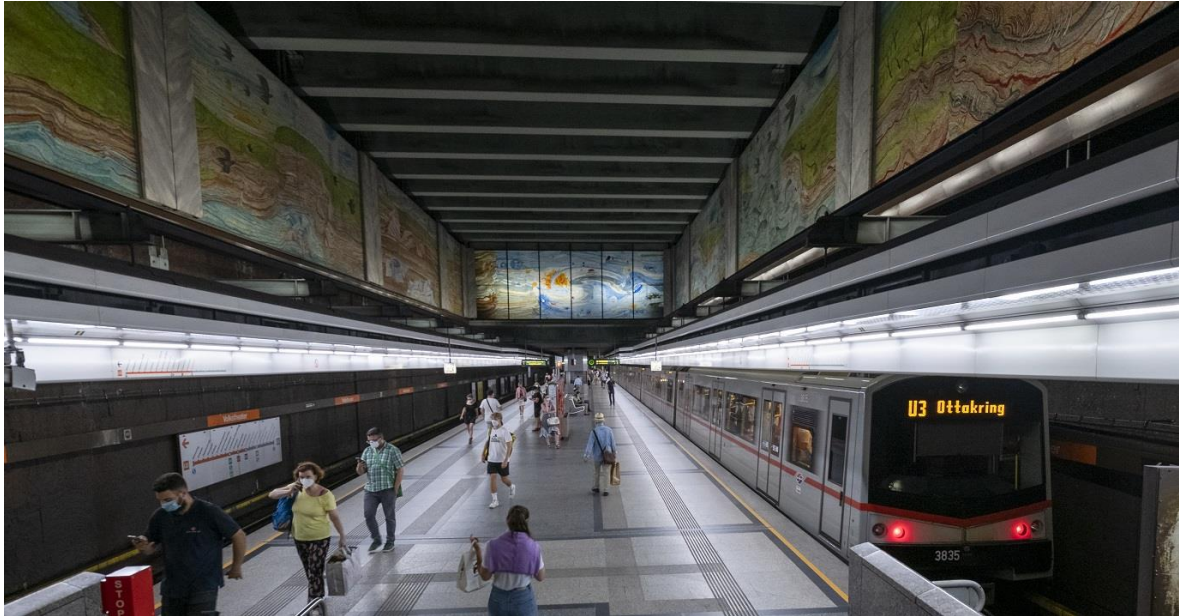
Slika 3.- Metro u Beču

kvaliteti života građana. Također rade na poboljšanju pješaćenja, bicikliranja i korištenja javnog prijevoza te mnogo investiraju u očuvanje i proširenje zelenih površina. To uključuje proširenje pješačkih zona, izgradnju novih biciklističkih staza i povećanje broja zelenih površina unutar grada, čime Beč postiže održiv i zdrav urbani život.