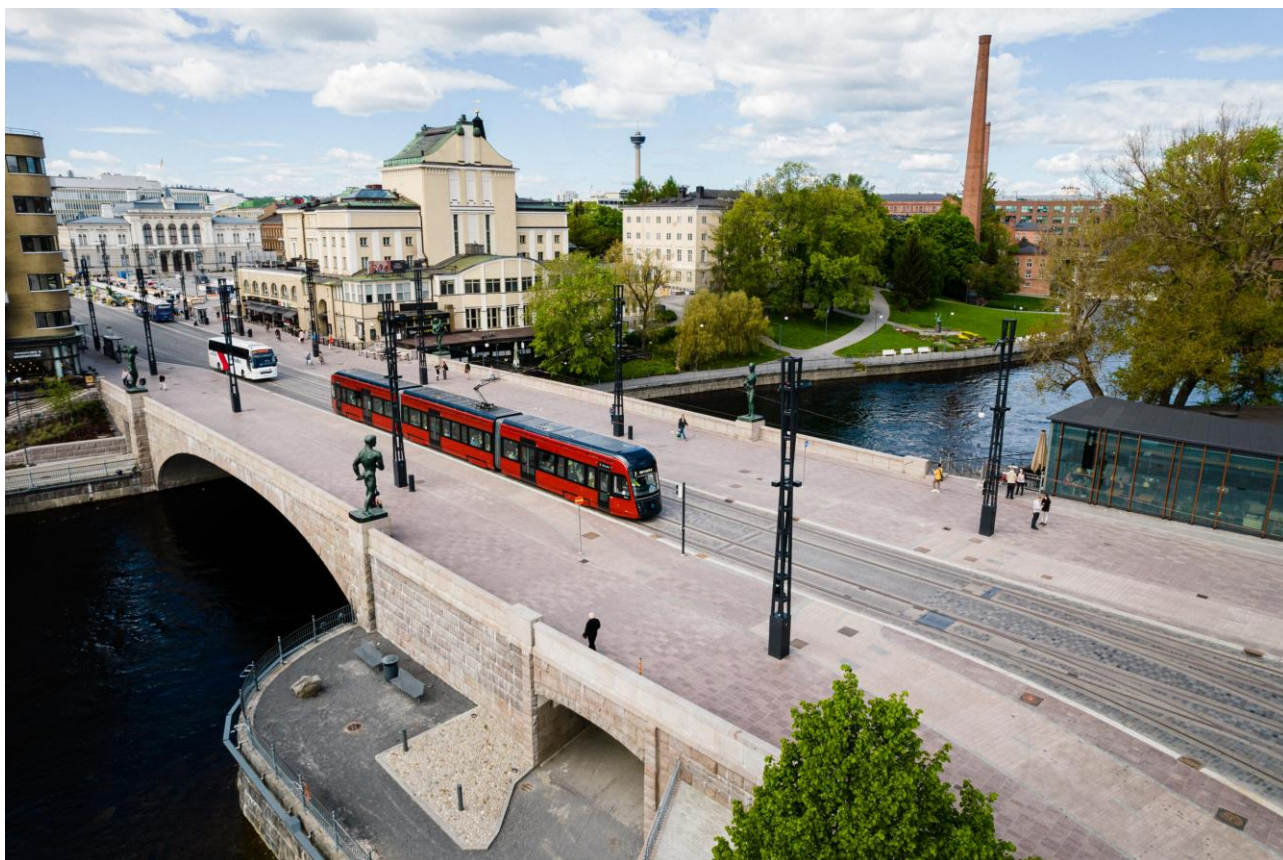
Slika 6. - Tramvaj u Tampere

Tampere se zalaže za malo drugačiju vrstu mobilnosti, jer im nisu cilj nove investicije nego bolje upravljati resursima koje posjeduju. Također, zalažu se za dijeljenje prijevoznih sredstava umjesto da ih posjeduje ili koristi samo jedna osoba, čime stvaraju učinkovit, ekološki prihvatljiv i ekonomičniji sustav mobilnosti