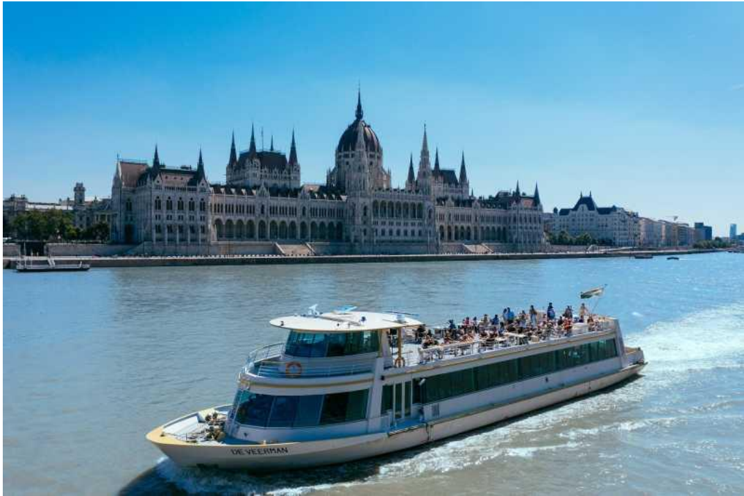
Slika 4. - Vožnja brodom po Dunavu