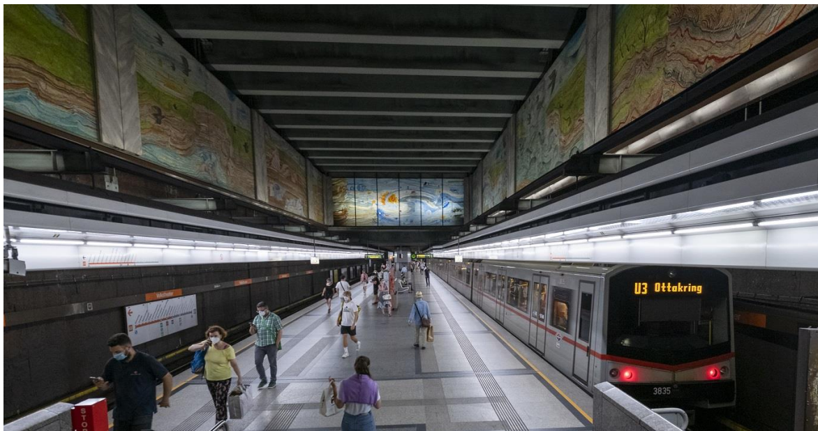
Slika 3.- Metro u Beču

kvaliteti života građana. Također rade na poboljšanju pješaćenja, bicikliranja i korištenja javnog prijevoza te mnogo investiraju u očuvanje i proširenje zelenih površina. To uključuje proširenje pješačkih zona, izgradnju novih biciklističkih staza i povećanje broja zelenih površina unutar grada, čime Beč postiže održiv i zdrav urbani život.