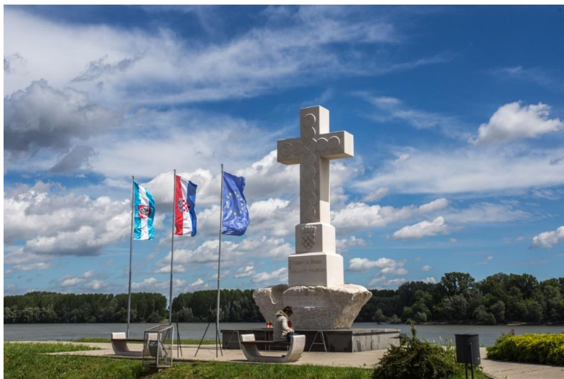
Slika 1 Mjesto sjećanja – križ na ušću rijeke Vuke u Dunav

obilježavanja značajnih događaja ne samo na mjestima sjećanja nego i u mjestima u kojima žive. Odgojno obrazovne institucije također imaju značajnu ulogu u prenošenju znanja i očuvanju tradicije o čemu će biti više riječi u poglavlju 6.5