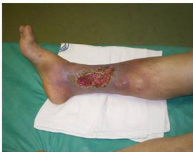
Slika 2.2.1. ulcerozni defekti na medijalnoj strani donjeg dijela noge

Koža oko ulkusa može pokazivati razne promjene, uključujući hemosiderozu, venski dermatitis, kontaktni dermatitis, bijele atrofije i fibroza potkožnog masnog tkiva, pri čemu je koža obično topla na dodir. Dno ulkusa često je prekriveno neurednim granulacijama, a može doći i do venskog krvarenja, što ulkus čini sličnim sirovom mesu. Rubovi rane su neravni, a mogu se pojaviti žute naslage ili nekrotično tkivo. Sekrecija iz ulkusa može biti značajna i varirati od zamućene do krvave. Okolina rane često pokazuje otok, proširene vene i hiperpigmentaciju. Dubina ulkusa može varirati, no najčešće su ulkusi plitki. Bol povezana s ulkusom obično je umjerena, iako može varirati, a često se smanjuje kada se noga podigne. Noga je obično topla na dodir. Ulcerozni defekti na potkoljenici najčešće se pojavljuju na medijalnoj strani donjeg dijela noge, kako je i prikazano na slici 2.2.1.[6]