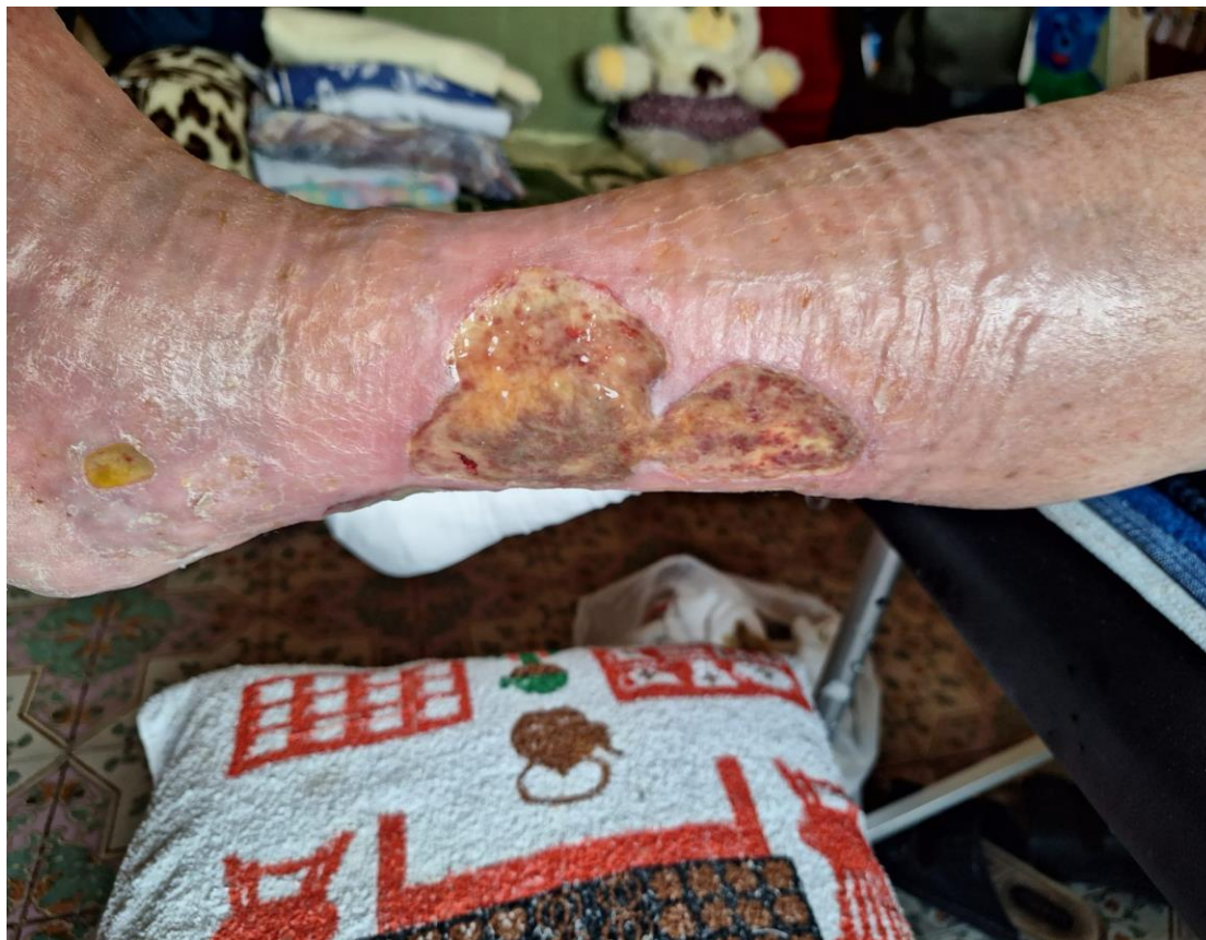
7.2. napredak liječenja ulkusa

Napredak ulkusa i pozitivan odgovor na terapiju, prikazuje slika 7.2.