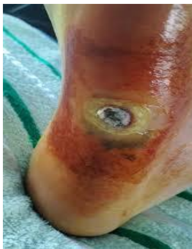
Slika 2.1.1. prikaz gangrene koja se razvila kao komplikacija na mjestu venskog ulkusa na peti

Arterijski ulkus je vrsta kronične rane koja nastaje zbog smanjenog protoka krvi u arterijama donjih ekstremiteta, obično kao posljedica periferne arterijske bolesti. Glavni uzrok arterijskih ulkusa je ishemija – nedostatak kisika i hranjivih tvari u tkivima uzrokovan suženjem ili blokadom arterija, često uzrokovanih aterosklerozom. Ključne karakteristike arterijskih ulkusa prema lokalizaciji su javljanje na područjima s minimalnim mekim tkivom, poput prstiju stopala, pete ili gležnja. Mogu se pojaviti i na mjestima pritiska, primjerice na strani stopala ili na potkoljenici. Prema izgledu su duboki, s jasnim rubovima i nekrotičnim (mrtvim) tkivom unutar rane. Koža oko ulkusa može biti suha, sjajna i hladna zbog nedostatka cirkulacije. Ulkus je često bolan, osobito noću ili kad je noga podignuta, jer je protok krvi još više ograničen u tim uvjetima. Simptomi koji su prisutni kod pacijenata obično su bol, osobito tijekom aktivnosti, jer mišići nogu ne dobivaju dovoljno kisika. Bol može postati stalna i intenzivna kako se stanje pogoršava. Komplikacije koje mogu nastati kod arterijskih ulkusa su sporo ili nikako ne zacjeljivanje zbog loše prokrvljenosti, a visoki rizik od infekcija može dovesti do ozbiljnih komplikacija poput gangrene, kao što je prikazano na slici 2.1.1.[4]