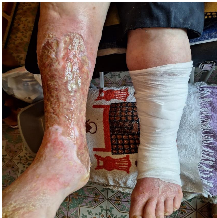
7.1. sanacija i zamatanje ulkusa

Pacijent negira alergije na lijekove. Međutim, zbog dugotrajne primjene obloga sa srebrom, razvio je preosjetljivost na srebro, pa je terapija prilagođena s ciljem izbjegavanja daljnje iritacije. Trenutno stanje pacijenta je u procesu sanacije. Trenutna sanacija i način zamatanja zavoja prikazana je na slici 7.1.