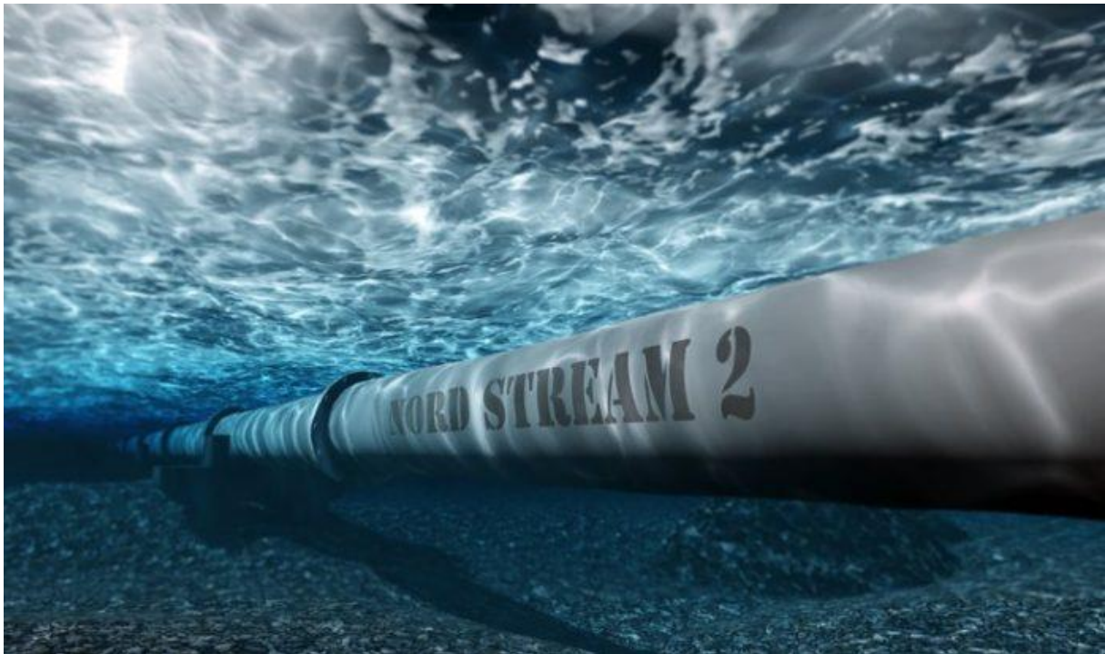
Slika br. 1 Plinovod Nord Stream

Rusija je jedan od najvećih dobavljača plina za Europu, a također je među vodećim svjetskim izvoznicima. Mnoge zemlje ovise o njoj nafti i plinu, što utječe na njihove odnose s drugim državama, posebice u slučaju Rusije i EU, koja je najveći kupac ruskih energenata. Stalna borba između moći i straha, između definiranja i provedbe međunarodne politike, mjesta su gdje ove dvije sile nastoje zaštititi svoje interese. Rusija, s jedne strane, ne u potpunosti, ali ovisi i o prihodima iz EU kao najvećeg kupca, dok EU, s druge strane, ovisi o Rusiji zbog uvoza gotovo polovice plina i nafte. Međutim, obje strane pokušavaju pronaći rješenja za smanjenje međusobne ovisnosti. Rusija to čini širenjem pristupa azijskom tržištu, dok EU razvija energiju iz obnovljivih izvora.