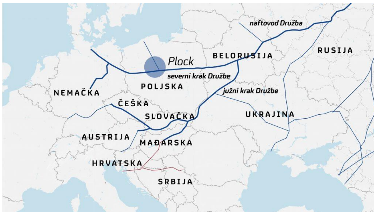
Slika br. 2 Naftovod Družba

Geopolitički aspekti energetske suradnje između EU i Rusije izazivaju pažnju zbog mogućnosti političkog utjecaja Rusije na energetske sigurnost EU. Ovisnost o ruskom plinu može dovesti do političkih pritisaka i manipulacija, kao i potencijalnih prekida opskrbe u slučaju geopolitičkih sukoba ili napetosti.