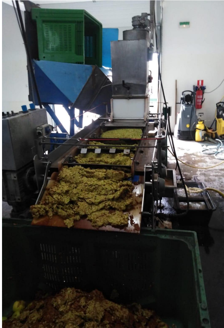
Slika 2.6. Tračna preša, izvor: Autor

Sok koji je odvojen od tropa prebacuje se u kacu gdje je smještena potopna pumpa (Slika 2.7.). Uz pomoć potopne pumpe sok se prebacuje u inox bačvu (Slika 2.8.) napravljenu od nehrđajućeg čelika, materijala koji ima visoku otpornost na koroziju.