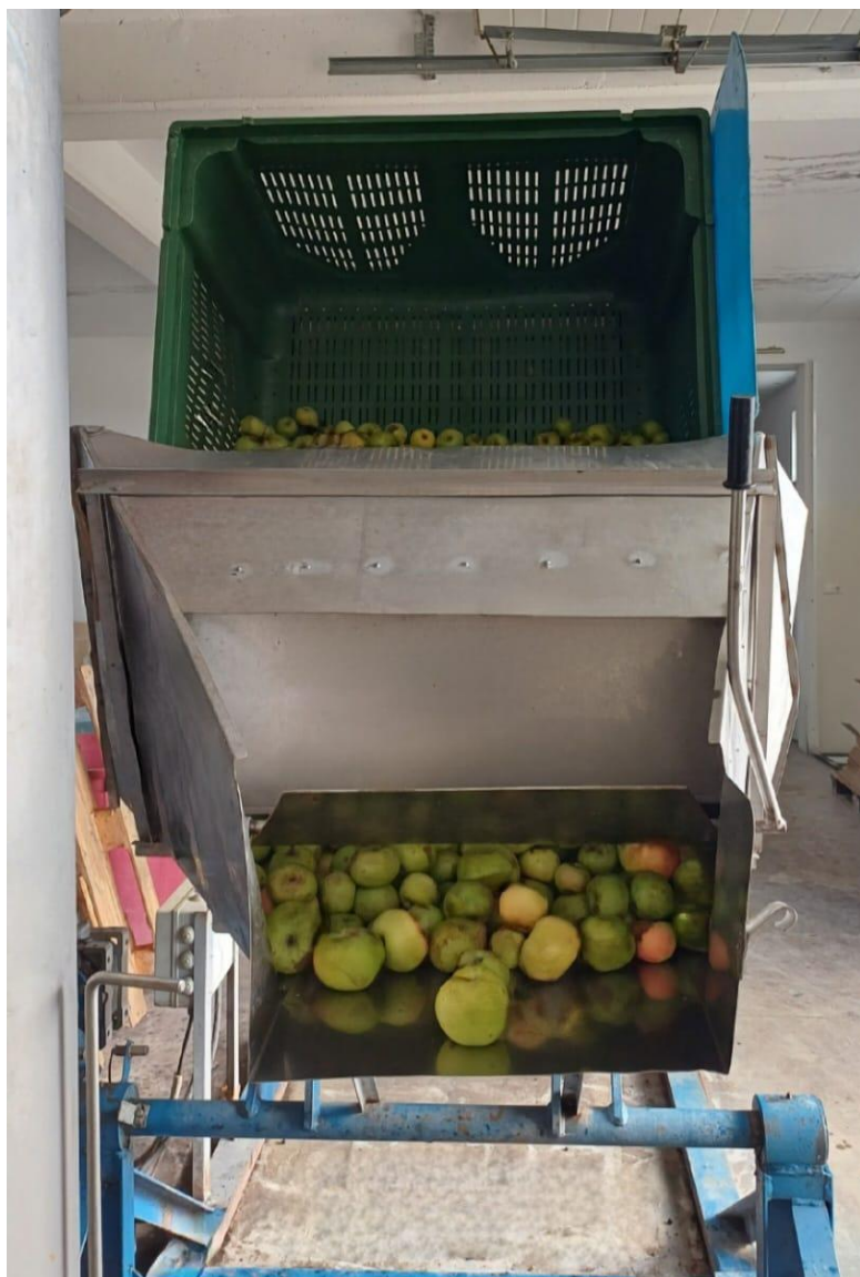
Slika 2.3. Usipavanje jabuka

Pranje voća (Slika 2.4.) ključan je korak u proizvodnji jer površina jabuke može biti kontaminirana mikroorganizmima, može sadržavati nečistoće te ostatke zaštitnih sredstava [1].