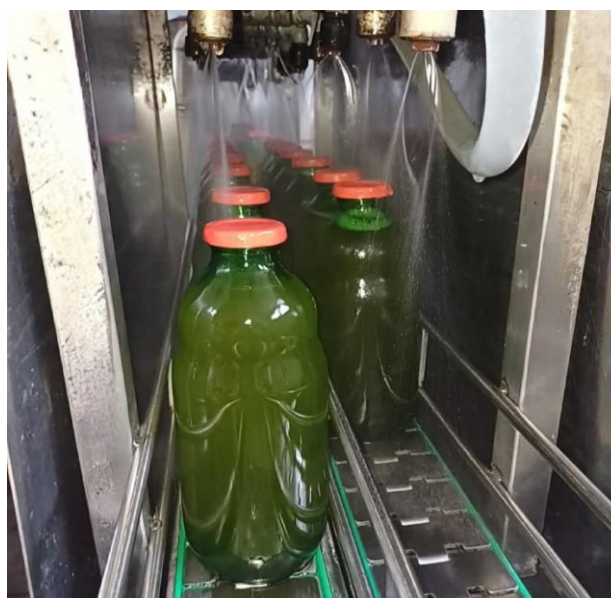
Slika 2.10. Hlađenje soka pod tuševima

Sok se zatim stavlja u uspravan položaj i prolazi kroz proces hlađenja pod tuševima (Slika 2.10.). Brzim hlađenjem soka koje traje 10 minuta smanjuje se temperatura soka čime se osigurava njegova higijenska ispravnost i produžava rok trajanja. Hlađenje pomoću tuševa omogućuje ravnomjerno i brzo snižavanje temperature soka uz stalni kontakt s hladnom vodom, sprečavajući termičke nejednakosti poput pregrijavanja u određenim dijelovima soka.