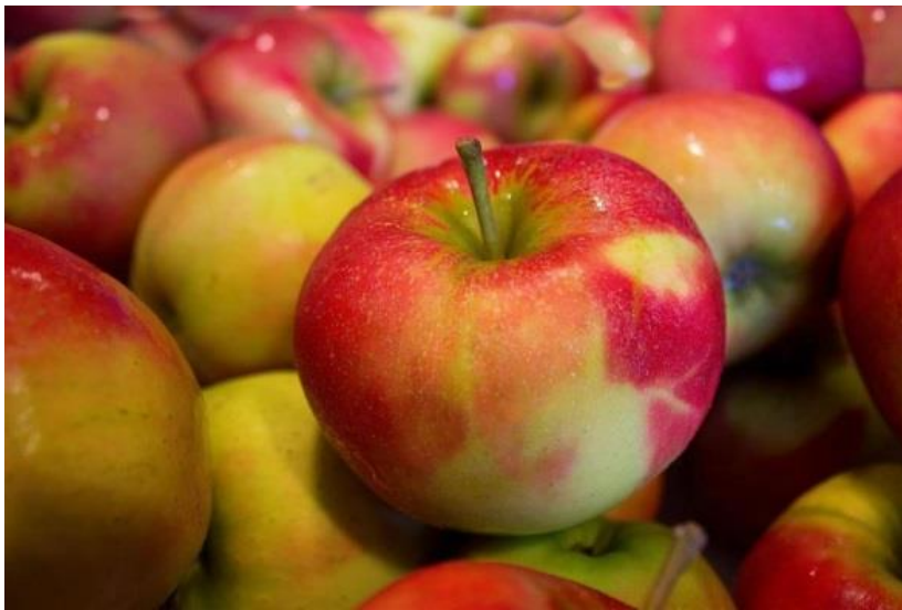
Slika 1.1. Idared

Jabuka pripada među najzastupljenije i najčešće konzumirane voćke u svijetu, zbog čega se ubraja u najpopularnije vrste voća (Slika 1.1.). Važan su izvor fitokemikalija i antioksidansa u ljudskoj prehrani. U usporedbi s ostalim voćem, sadrže male količine bjelančevina i masti, ali su bogate topivim vlaknima, posebno pektinom. Količina šećera i organskih kiselina u jabukama varira ovisno o sorti, a visok omjer šećera i kiselina posebno je važan za preradu i konzumaciju [1].