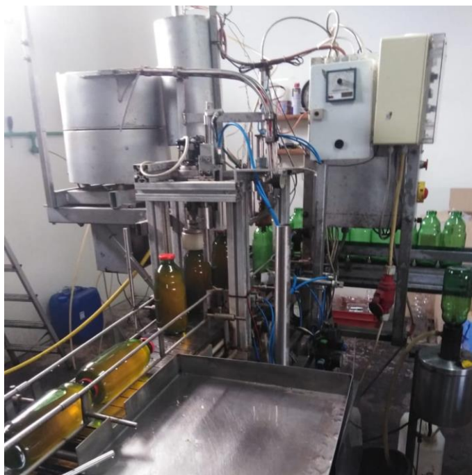
Slika 2.9. Punionica

Sok se zatim stavlja u uspravan položaj i prolazi kroz proces hlađenja pod tuševima (Slika 2.10.). Brzim hlađenjem soka koje traje 10 minuta smanjuje se temperatura soka čime se osigurava njegova higijenska ispravnost i produžava rok trajanja. Hlađenje pomoću tuševa omogućuje ravnomjerno i brzo snižavanje temperature soka uz stalni kontakt s hladnom vodom, sprečavajući termičke nejednakosti poput pregrijavanja u određenim dijelovima soka.