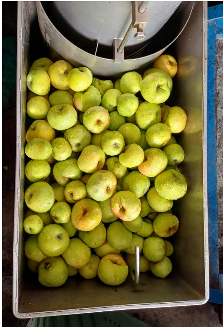
Slika 2.4. Uređaj za pranje i mljevenje jabuka, izvor: Autor

Nakon pranja slijedi faza usitnjavanja voća koja se obavlja pomoću mlina čekićara (Slika 2.5.). Mlin je namijenjen usitnjavanju jabuka na manje milimetarske komadiće nepravilnog oblika. Usitnjavanjem voća razbija se tkivo i oštećuju stanice kako bi se sok lakše mogao izdvojiti i iscijediti [1].