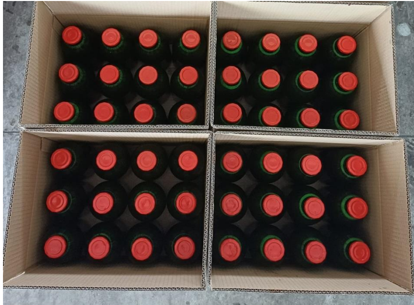
Slika 2.11. Sok u kartonskoj kutiji

Sok je potrebno skladišti na suhom i hladnom mjestu kako bi se očuvala kvaliteta proizvoda [1].