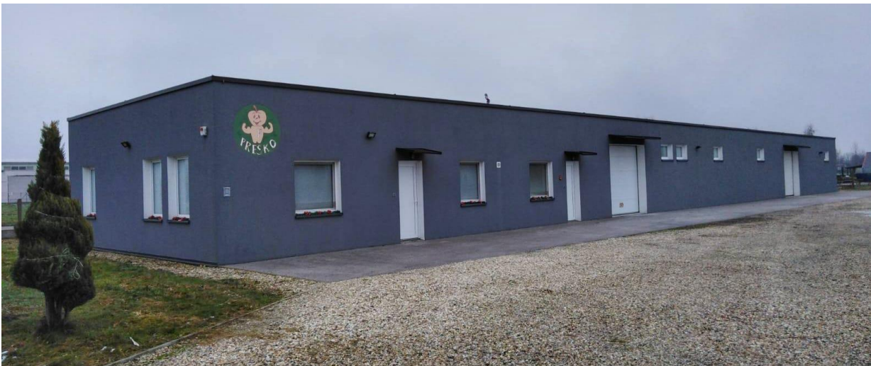
Slika 2.1. Prešaona voća i povrća "Preško"