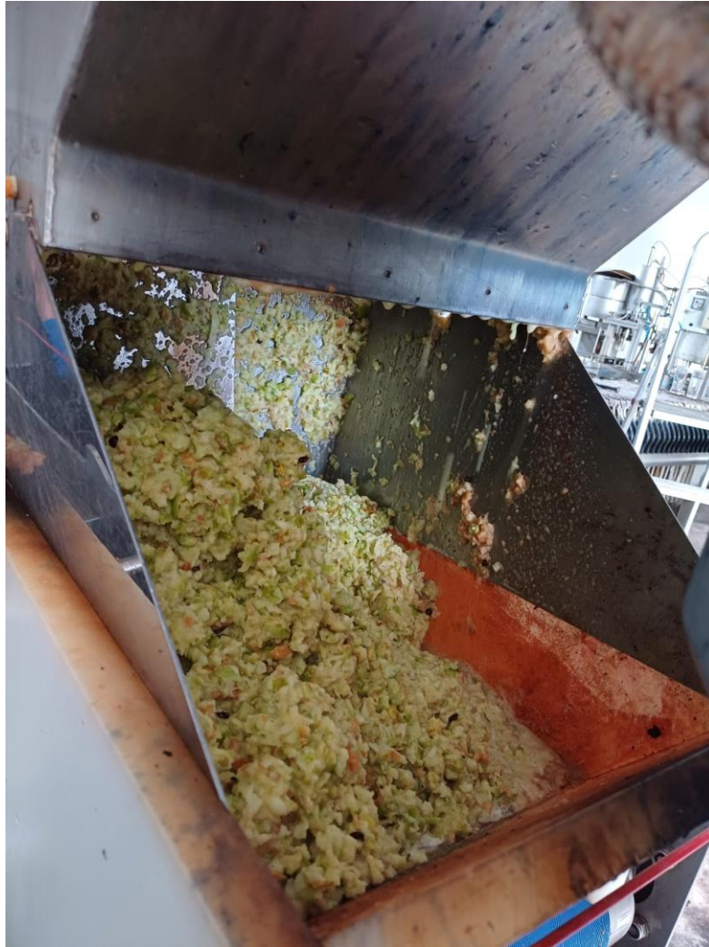
Slika 2.5. Usitnjavanje jabuka pomoću mlina čekićara

Kaša koja je nastala prilikom mljevenja jabuka pada u tračnu prešu (Slika 2.6.) koja se neprekidno rotira. Valjci na tračnoj preši dizajnirani su tako da najprije lagano istisnu sok iz kaše, zatim srednje i na kraju najviše. Stalna rotacija tračne preše omogućuje optimalno cijedenje soka te odvajanje soka od tropa. Sok se sakuplja u posebnom spremniku, dok se trop koji je nusprodukt cijedenja, sakuplja u sanducima smještenoj iza preše. Taj dio procesa osigurava maksimalno iskorištavanje sirovine te minimiziranje otpada.