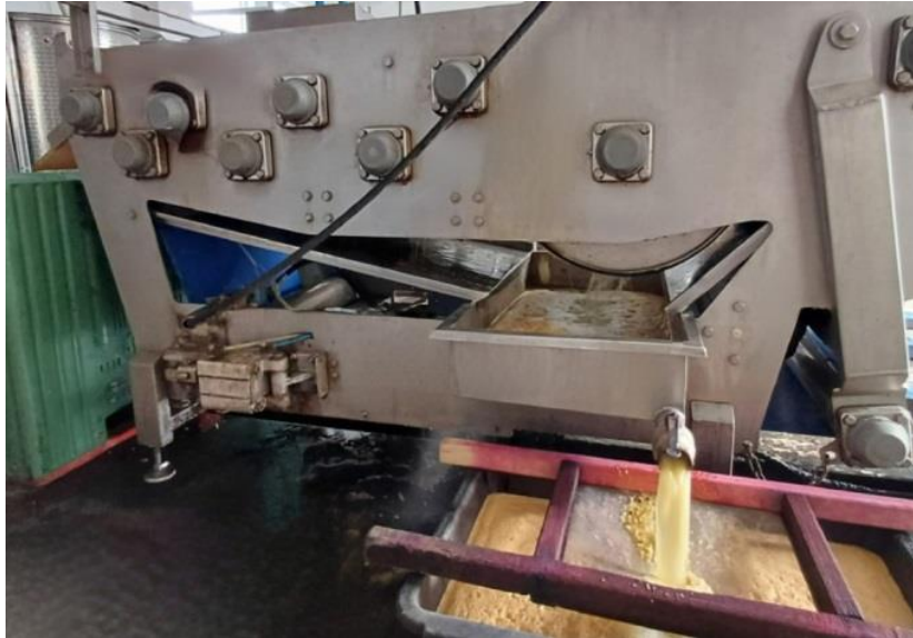
Slika 2.7. Slijevanje soka u kacu, izvor: Autor

Inox materijal građen od nehrđajućeg čelika koji je otporan na rast bakterija i mikroorganizama, što doprinosi očuvanju higijene i sigurnosti proizvoda. Njegova otpornost čini ga idealnim materijalom za kontakt sa sokovima, jer ostaje čist i sjajan u normalnim atmosferskim uvjetima. Ako ne nastupi značajna kemijska reakcija poput oksidacije ili korozije između čelika i soka, materijal će ostati netaknut dok će sok biti zaštićen od zagađenja metalnim česticama ili korozivnim produktima [9].