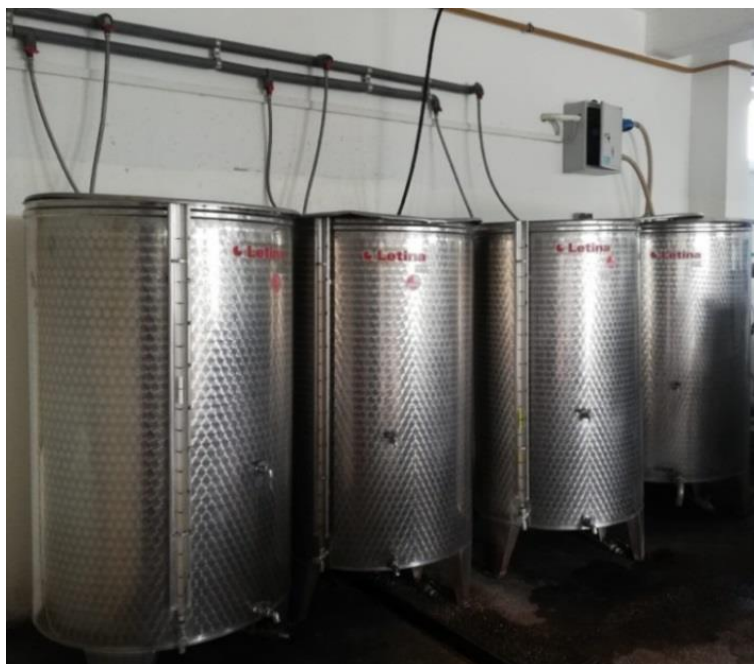
Slika 2.8. Sok u inox bačvama

Inox materijal građen od nehrđajućeg čelika koji je otporan na rast bakterija i mikroorganizama, što doprinosi očuvanju higijene i sigurnosti proizvoda. Njegova otpornost čini ga idealnim materijalom za kontakt sa sokovima, jer ostaje čist i sjajan u normalnim atmosferskim uvjetima. Ako ne nastupi značajna kemijska reakcija poput oksidacije ili korozije između čelika i soka, materijal će ostati netaknut dok će sok biti zaštićen od zagađenja metalnim česticama ili korozivnim produktima [9].