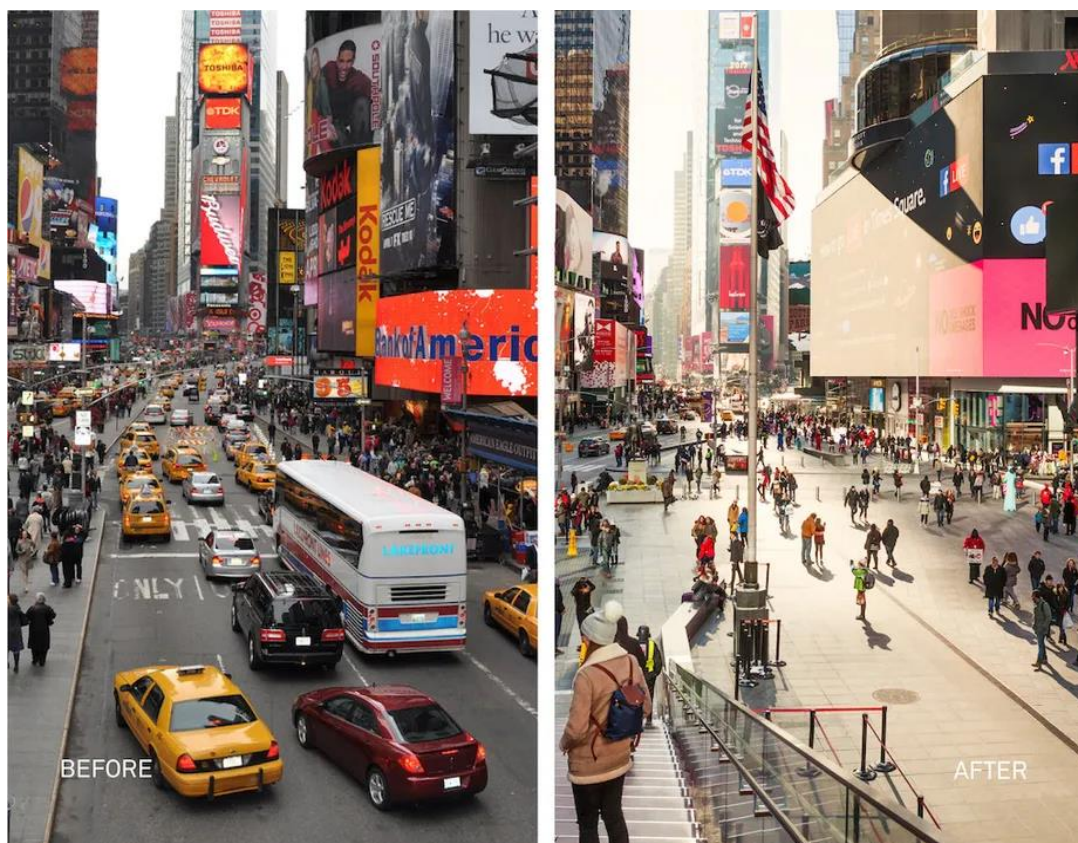
Slika 1: Times Square prije i poslije postavljanja trajne pješačke zone

Primjeri prikazani na Slici 1 poput Times Square-a u New Yorku pokazuju kako taktički urbanizam može transformirati prometne čvorišta u žive, društveno aktivne prostore zbog privremenih pješačkih zona. U Parizu, privremeni biciklistički koridori uvedeni tijekom pandemije COVID-19 dodatno ilustriraju kako taktički urbanizam može odgovoriti na hitne potrebe, a istovremeno dugoročno poboljšati kvalitetu života u gradu. Gradovi poput Buenos Airesa i Bogote koriste taktički urbanizam za stvaranje privremenih parkova i javnih prostora u gusto naseljenim četvrtima. To su četvrti gdje je prostor ograničen, a potrebe za društvenim okupljanjem velike. Taktički urbanizam također promiče socijalnu inkluziju i participaciju zajednice osim fizičkih promjena. Građani postaju aktivni sudionici u procesu oblikovanja prostora i time jačaju osjećaj pripadnosti i odgovornosti prema lokalnoj sredini. Taktički urbanizam mijenja način na koji koristimo urbani prostor i način na koji gradovi komuniciraju sa svojim stanovnicima. Ovaj pristup omogućuje gradovima da budu dinamični, prilagodljivi i usmjereni na ljude, a ne samo na infrastrukturu. To čini taktički urbanizam važnim dijelom urbane transformacije te postavlja temelje za održivu budućnost gradova širom svijeta. [1]