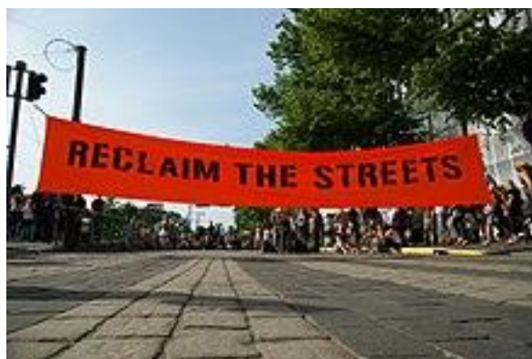
Slika 5: Reclaim the streets znak u Londonu