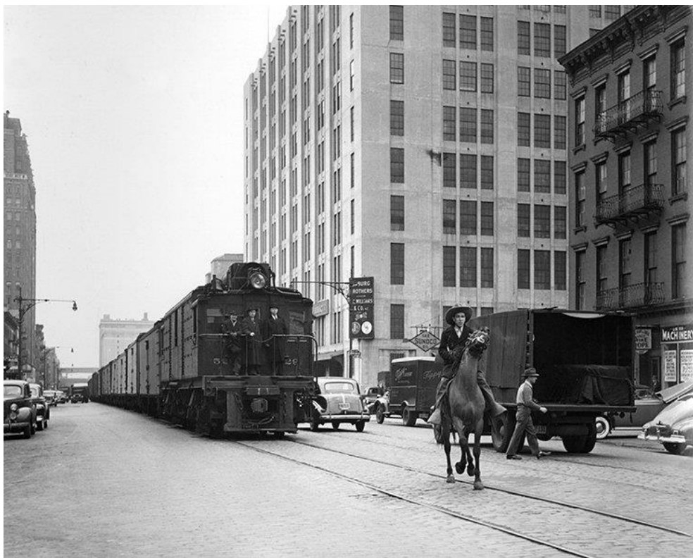
Slika 2: 10. avenija 1920-ih

High Line Park u New Yorku predstavlja odličan primjer urbanog preobražaja. Njegova povijest vrlo dobro prikazuje društvene i infrastrukturne promjene koje su oblikovale donji Manhattan kao što vidimo na Slici 2. Te iste promjene se mogu iskoristiti za daljnji razvoj modernih urbanih područja u gradovima diljem svijeta. Krajem 19. stoljeća, ulicama donjeg Manhattana prometovali su teretni vlakovi kompanije New York Central Railroad. Oni su