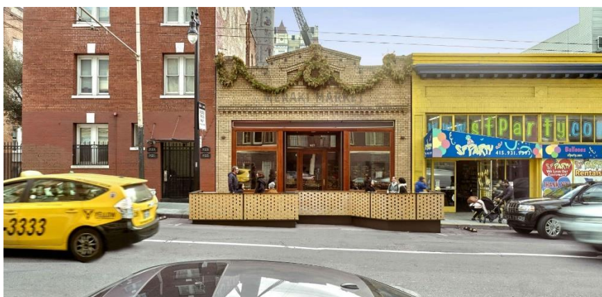
Slika 4: Parklet San Francisco

Parkleti predstavljaju inovativan pristup urbanom planiranju, omogućuju transformaciju parkirnih mjesta u prostore koji su prilagođeni ljudima, a ne automobilima. Ovi mali, često privremeni prostori služe kao okupljališta za zajednicu, priliku za odmor, druženje i uživanje u gradskom okruženju. Njihova popularnost raste u gradovima koji se suočavaju s potrebom za većim javnim prostorima, koji potiču interakciju među građanima. Parkleti su postali simbol promjena u načinu korištenja javnog prostora, pokazujući kako se jednostavnim i kreativnim rješenjima mogu ostvariti značajne promjene u urbanim sredinama. Ovaj koncept unapređuje fizički izgled grada, jača socijalnu povezanost unutar zajednice i pruža platformu za sudjelovanje građana u oblikovanju vlastitog okruženja. Parkleti su više od samo fizičkih intervencija, oni su agenti promjene koji potiču nove načine razmišljanja o javnim prostorima i zajedničkom korištenju. [2,6]