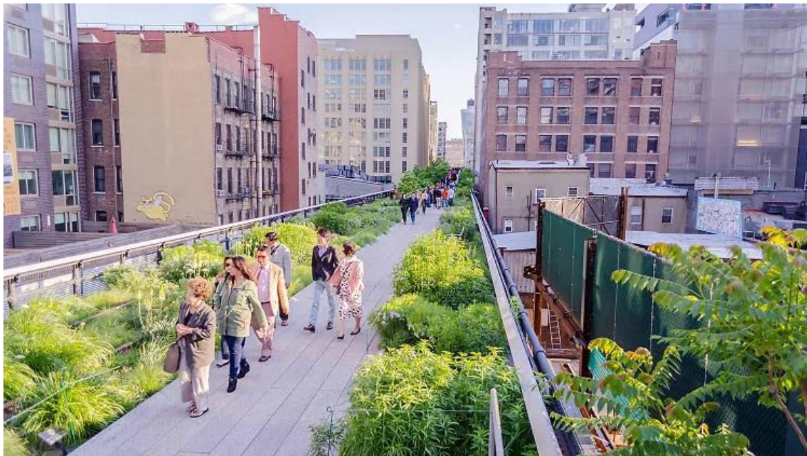
Slika 3: Highline park 2024.

potaknula daljnje urbanističke inicijative i pokazala kako se pomoću taktičkog urbanizma može stvoriti održivi i pristupačni prostor koji služi kao inspiracija za slične projekte diljem svijeta. [5]