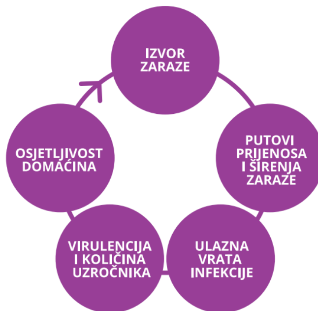
Slika 2.2.1. Vogralikov lanac

Najjednostavniji način objašnjavanja prijenosa infekcije je putem Vogralikovog lanca. Njega je sa suradnicima razvio ruski epidemiolog i infektolog G.F. Vogralik, a sam se lanac sastoji od pet međusobno povezanih čimbenika koji, ukoliko je zadovoljen svaki element, rezultira infekcijom. Dakle, lanac koji je prikazan ispod (Slika 2.2.1.) započinje izvorom zaraze koji može biti čovjek ili životinja koji izlučuje klice kod kojeg može, ali i ne mora biti razvijena bolest. Izvor zaraze također može biti i neki rezervoar zaraze na kojem se mikroorganizmi nalaze, ali ne mogu se širiti na druge ljude ili životinje. Drugi element lanca je put kojim se širi bolest što može biti izravno, neizravno, putem zraka ili vode, preko vektora, zemlje ili posteljice. Treći element jesu ulazna vrata infekcije koji može biti oko, uho, usta, nos, spolni organi ili koža. Četvrti čimbenik su broj i virulencija klica, što znači da stupanj patogenost to jest sposobnost mikroorganizma da uzrokuje bolest i količina klica mora biti dovoljno visoka kako bi uzrokovala bolest. I zadnji čimbenik jest osjetljivost domaćina u koje spada same karakteristike domaćina počevši od njegove prve linije obrane koža i sluznice, zatim nespecifični celularni i kemijski odgovor na klice i specifični imuni odgovor [8]. Ukoliko izostane jedan od ovih 5 elementa do zaraze neće doći.