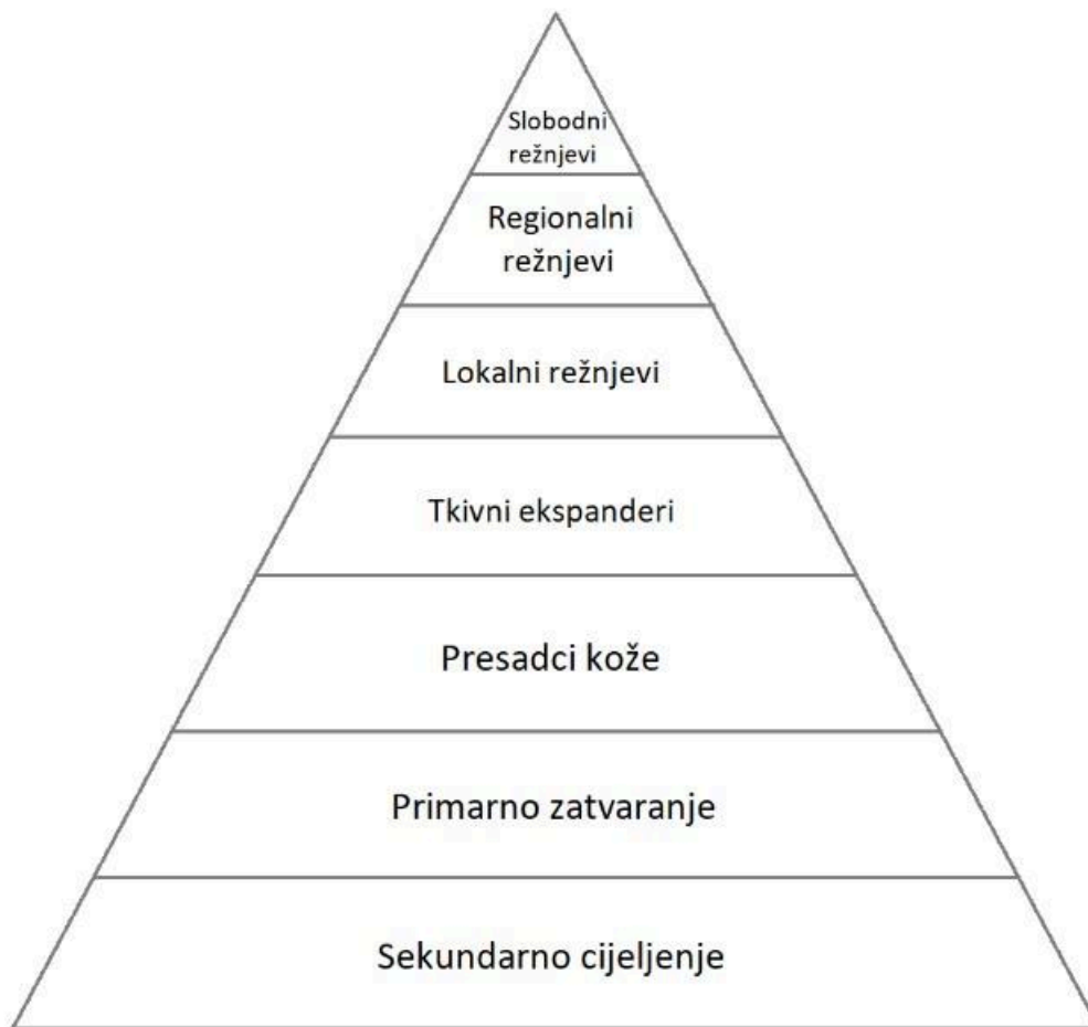
Slika 1. Rekonstrukcijska piramida.

U situacijama kada na mjestu velikog defekta nema dovoljno kože za estetski prihvatljivo zatvaranje rane, kirurg mora odabrati sekundarnu tehniku. Iako se ekspanzija tkiva koristi u rekonstrukciji regije glave i vrata, ovaj postupak odvija se kroz nekoliko faza i može produljiti i/ili produljuje vrijeme rehabilitacije. U nekim slučajevima koriste se transplantati kože tj. kožni presadak zvan thiersch, bilo pune ili djelomične debljine, pri čemu koža s donorskog mjesta na tijelu treba što je moguće više biti slična boji i kvaliteti kože mjesta gdje se nalazi svojevrsni defekt. Veliki i duboki defekti mekih česti u području glave i vrata ponekad zahtijevaju uporabu regionalnih i/ili slobodnih reznjeva (46).