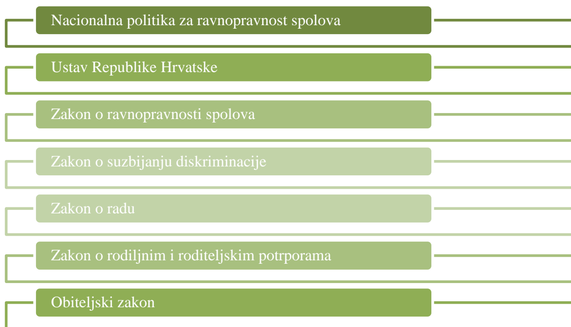
Shema 2. Pravi akti za reguliranje ravnopravnosti spolova u RH

U Republici Hrvatskoj vidljiv je veliki napredak kada je u pitanju ravnopravnost spolova, a tome je uvelike i pridonijelo članstvo u Europskoj uniji. Da bi ravnopravnost poslova bila stvarna i provediva, potrebno je donijeti i pravne akte koji će omogućiti provedbu istoga u praksi. U nastavku rada shema 2 prikazuje najznačajnije pravne akte o ravnopravnosti spolova u Republici Hrvatskoj.