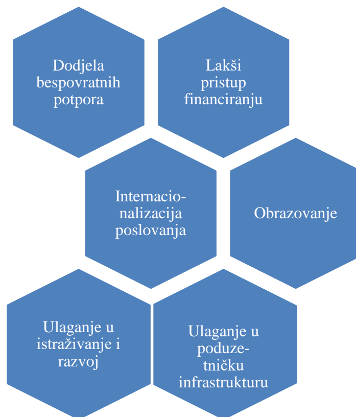
Shema 3. Poticanje poduzetništva i obrta kod žena kroz Poduzetnički impuls