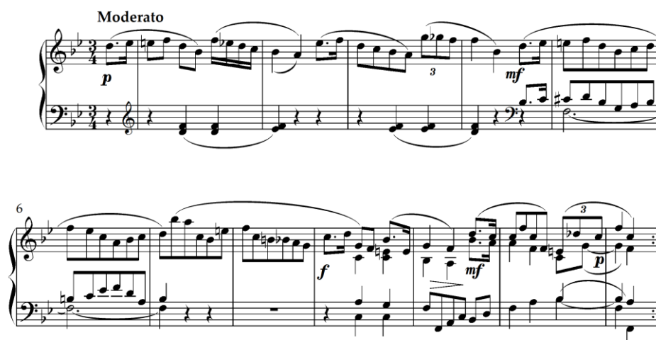
Slika 4.2.1. Početak Varijacije I (||: a :||, taktovi 1-12)

Prva varijacija u B-duru također je trodijelnog oblika (||: a :||: b a :||) i predstavlja formalnu varijaciju strogog tipa. Rikard Schwarz u prvoj varijaciji razrađuje cijeli Mozartov prvi Menuet s