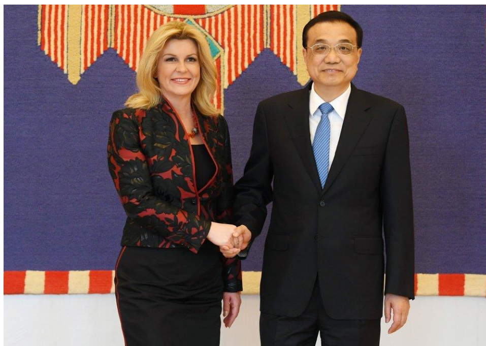
Slika 4. Sastanak predsjednice Republike Hrvatske Kolinde Grabar-Kitarović i kineskog premijera Li Keqianga

Službena posjeta Hrvatskoj od strane kineskog premijera trajati će od 9. do 12. travnja 2019. godine, u Zagrebu i Dubrovniku, riječ je o jednom od najvažnijih vanjskopolitičkih događaja u Hrvatskoj do sada. Uz premijera stiglo je i izaslanstvo od gotovo 250 političara i gospodarstvenika. Posjeta je bila usmjerena na jačanje bilateralnih odnosa između Kine i domaćina, cilj je bio poboljšati suradnju u različitim područjima poput trgovine, investicija, kulture i tehnološkog razvoja.