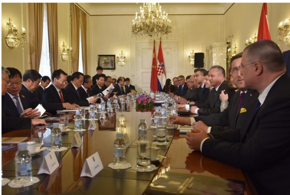
Slika 2. Službeni sastanak šefova vlada država srednje i istočne Europe i Kine u Hotelu Palace

Jedan od temeljnih aspekata međunarodne diplomacije je dijalog i pregovaranje, što podrazumijeva vođenje razgovor između država s ciljem rješavanja sukoba, postizanja sporazuma i promicanje suradnje. Diplomacija često uključuje sudjelovanje u međunarodnim organizacijama kao što su Ujedinjeni narodi (UN), Europska unija (EU) ili NATO, gdje se donose odluke koje utječu na globalnu politiku.