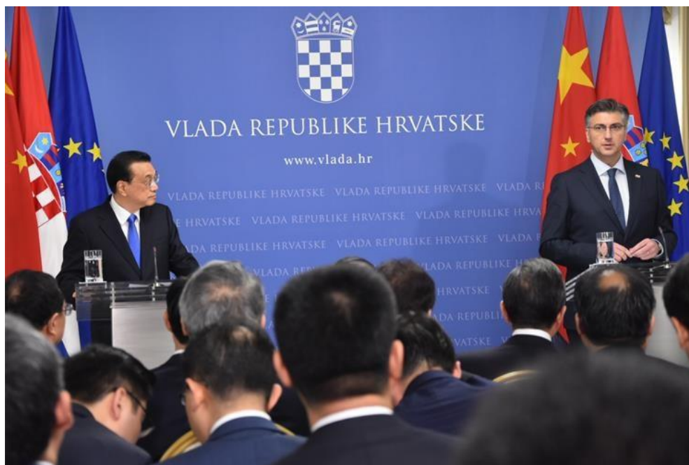
Slika 3. Konferencija za medije- zajedničke izjave za medije predsjednika Vlade Andreja Plenkovića i predsjednika državnog vijeća Narodne Republike Kine Li Keqiang (Izvor: vlada.hr)

Funkcija medija u izvještavanju o međunarodnim događajima u prvom redu ima obvezu transparentnog informiranja javnosti, primjerice novinari mogu diplomatima pomoći oko jednog od ključnog problema, izazova današnjice a to je strah od dezinformacije i lažnih vijesti. Ugledne medijske institucije i novinari još uvijek uživaju određeni stupanj vjerodostojnosti u digitalnom prostoru. Kada novinari prenose izjave diplomata, oni na neki način posuđuju svoj kredibilitet, samim time povećavaju potencijalni utjecaj poruke digitalne diplomacije. Iako digitalne platforme omogućuju diplomatima izravnu on line komunikaciju s publikom, te prezentiranje svoje vanjske politike, također mogu ograničiti njihov doseg. U toj situaciji, novinari i medijske kuće mogu odigrati ključnu ulogu, pomažući diplomatima da dopru do ciljane publike [6].