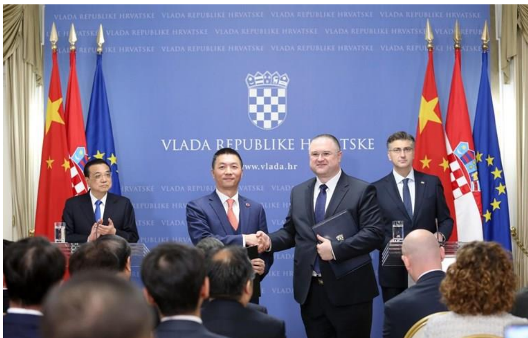
Slika 5. Poslovni forum zemalja srednje i istočne Europe i Kine

Tijekom foruma biti će predstavljena internet stranica za Koordinacijski mehanizam 16+1 za malo i srednje poduzetništvo, čiji je Hrvatska nositelj. Na kraju dogovorene sjednice planira se potpisivanje niza ugovora i sporazuma o suradnji između Kine i ostalih sudionica [10].