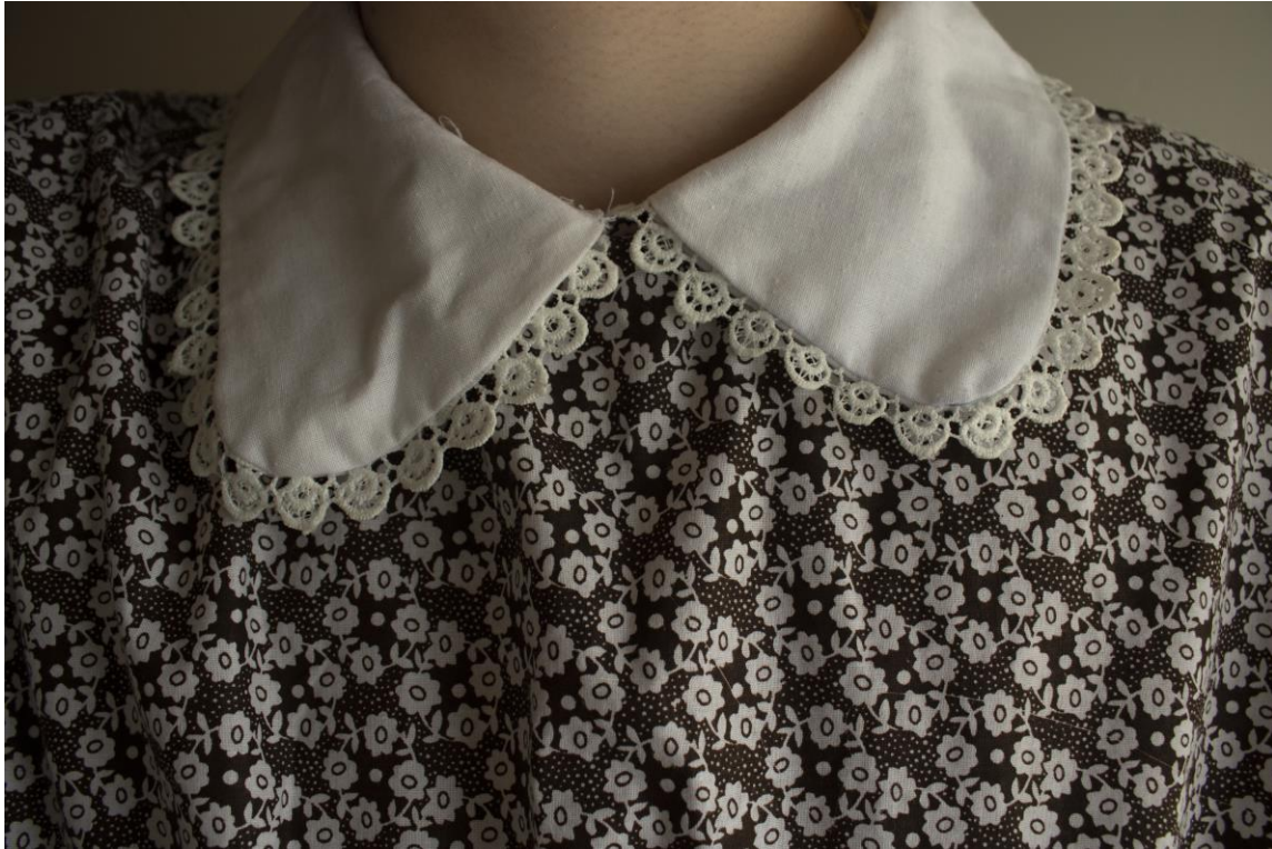
Slika 18: Kragna kostima, Autor