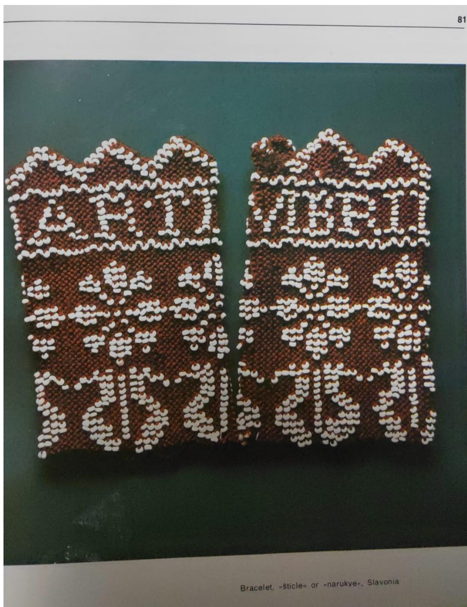
Slika 19: Inspiracija za dodatak rukavica

nasljeđem zanatske vještine. Kapicu sam izradila upotrebom poliesterske tkanine, pažljivo je izrezujući u oblik kvadrata. Počela sam tako što sam sašila donji dio i stražnju stranu kako bih dobila jednostavan, ali elegantan dizajn koji nježno prijanja uz glavu. Na prednjoj strani kapice kreirala sam uredno porubljeni rub, čime se postiže lijep završni izgled i dodatna struktura. Kapica se zatvara trakama ušivenim na bočnim stranama, koje se vežu u mašnu ispod vrata i time kostimu dodaju dozu šarma i tradicionalnog duha. Ovaj detalj ne samo da upotpunjuje izgled već pruža praktičnost, osiguravajući čvrsto pričvršćivanje kapice tijekom izvedbe.