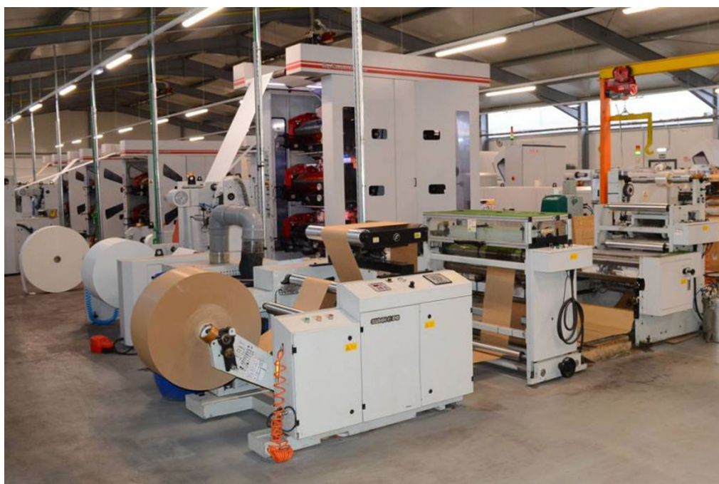
Slika 1 Proizvodni pogon tvrtke Eko papir