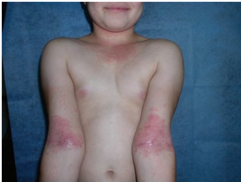
Slika 2.3.2 Karakteristična distribucija promjena u starijeg djeteta (vrat, dekolte, laktovi) Izvor: Slobodna Murat-Sušić: Atopijski dermatitis u djece, Medicus, Vol 16, Br. 1, 2007

inverziju i zahvaćeniji su ekstenzorni dijelovi. Ako su prisutne promjene na licu tada je zahvaćen periorbitalni i perioralni dio kože.[2]