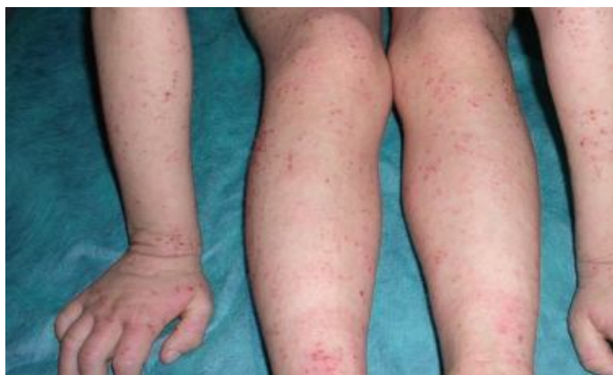
Slika 2.3.3 Generalizirane promjene uz ekzorijacije na ekstremitetima

3. Atopijski dermatitis odrasle dobi obuhvaća razdoblje od puberteta do odrasle dobi. Predilekcijska su mjesta fleksorni dijelovi udova, lice, vrat, gornji dijelovi ruku i leđa, dorzum šake i stopala, prsti ruku i nogu. Erupcije su vidljive kao suho ljuštenje eritematoznih papula i plakova koji su lihenificirani. Vlažnost, kraste i eksudacija često su rezultat superinfekcije stafilokokom. Mogu se vidjeti poslijeupalne hipopigmentacije ili hiperpigmentacije, koje su prolazne i reverzibilne.[2]