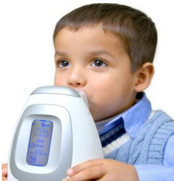
Slika 3.4.1 Primjena FENO-a u djece