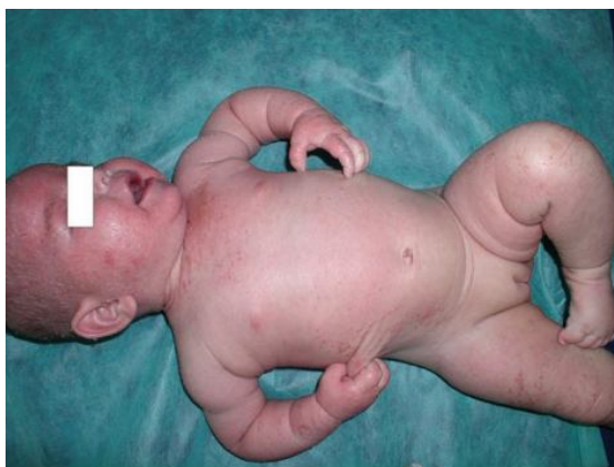
Slika 2.3.1 Dojenče s generaliziranim atopijskim dermatitisom uz izražen svrbež

1. Infantilna faza AD-a- obuhvaća razdoblje od rođenja do druge godine života. Eritematozne papule i vezikule tipično počinju na licu, čelu ili tjemenu, a praćene su intenzivnim svrbežom zbog kojega dijete plače. Lezije mogu ostati na licu ili se proširiti na trup ili ekstenzorne dijelove udova. Obično su simetrične. Egzacerbacija dermatitisa često se vidi na medijalnim dijelovima obraza i na bradi i podudara se s nicanjem zuba i uvođenjem krute hrane. Na zahvaćenim dijelovima kože vide se edem, vlaženje i kraste, neovisno o sekundarnoj infekciji. S 8-10 mjeseci života često se promjene pojavljuju na ekstenzornim dijelovima ruku i nogu. Nakon prve godine života i kasnije pojavljuju se numularne lezije koje su često podložne sekundarnoj infekciji.[2]