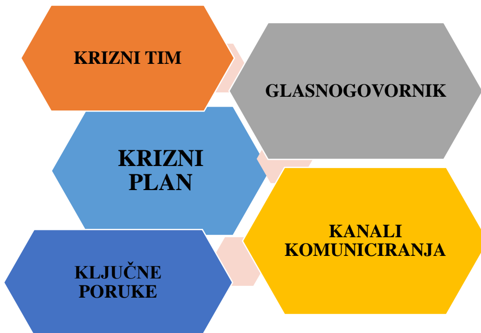
Slika 2. Elementi plana za rješavanje krize