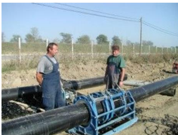
Slika 2.5 Radovi na izvedbi sustava odvodnje procjednih voda ( http://his.hr , 2016.)

Ploha 6 je u cijelosti izvedena s cijevima promjera 200/175 mm. Ukupna dužina drenažnih cijevi (uključivo i pune cijevi kroz nasip) na plohama 1 do 6 iznosi 6.531 m.