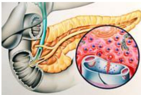
Slika 2.1. Gušterača

Gušterača (lat. pancreas) je žlijezda s endokrinim i egzokrinim izlučivanjem, a nalazi se na stražnjoj trbušnoj stijenci u visini prvog i drugog slabinskog kralješka. Proteže se transversalno od dvanaesnika do hilusa slezene. Dugačka je oko 15 cm. Gušterača se dijeli na tri dijela, a to su caput, corpus i cauda, a prikazana je na slici 2.1. Egzokrine stanice u gušterači čine 98% tkiva. One stvaraju pankreasni sok putem kojeg izlučuju probavne enzime kao što su amilaze, lipaze, proteaze, te elektrolite. Temeljnu jedinicu egzokrinog dijela gušterače čini složena acinusna žlijezda s izvodnim vodom, a endokrini dio gušterače sastoji se od četiri vrste stanica koje su grupirane u Langerhansove otočiće. To su Beta- stanice koje luče inzulin, Alfa- stanice koje luče glukagon, D- stanice koje luče somatostatin i PP stanice koje luče pankreatični polipeptid.[6]