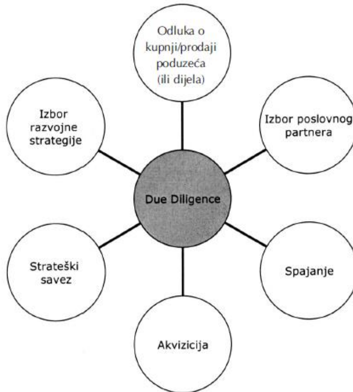
Slika 2.1. Potreba provođenja due diligence-a

Sve navedeno prikazano je na sljedećoj slici.