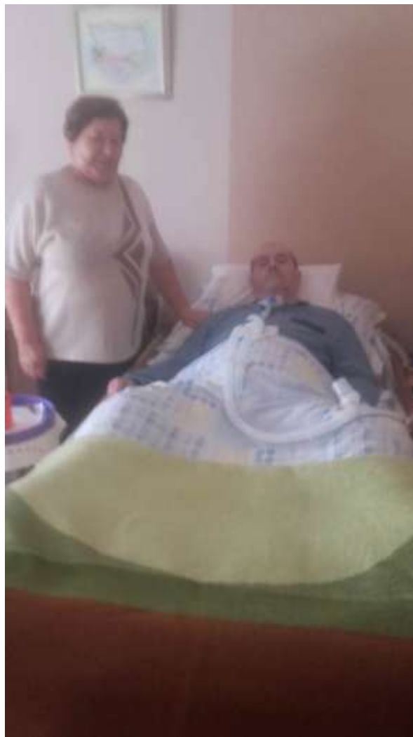
Slika 6.1. Prikaz gospođe V.P. i gospodina L.P.

Ciljevi korištenja prikaza slučaja u završnom radu kod bolesnika L.P. čije se zdravstveno stanje prati niz godina, omogućilo je utvrđivanje i očuvanje najbolje moguće kvalitete života, doprinijelo donošenju smjernica za kvalitetniji život bolesnika i njegove obitelji s traheostomom, te donošenje smjernica za poboljšanje kvalitete rada medicinskog osoblja i struke generalno. Za potrebe prikaza slučaja korišten je intervju s bolesnikom i njegovom suprugom te analiza dokumentacije g. L.P.