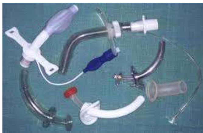
Slika 3.4.4.1. Prikaz vrsta kanila

Govorne kanile su one koje se pri izdisaju zatvore preklapanjem metalne ili plastične pločice, tako da zrak mimo kanile stiže u grkljan pa bolesnik može govoriti bez zatvaranja kanile prstom.[6]