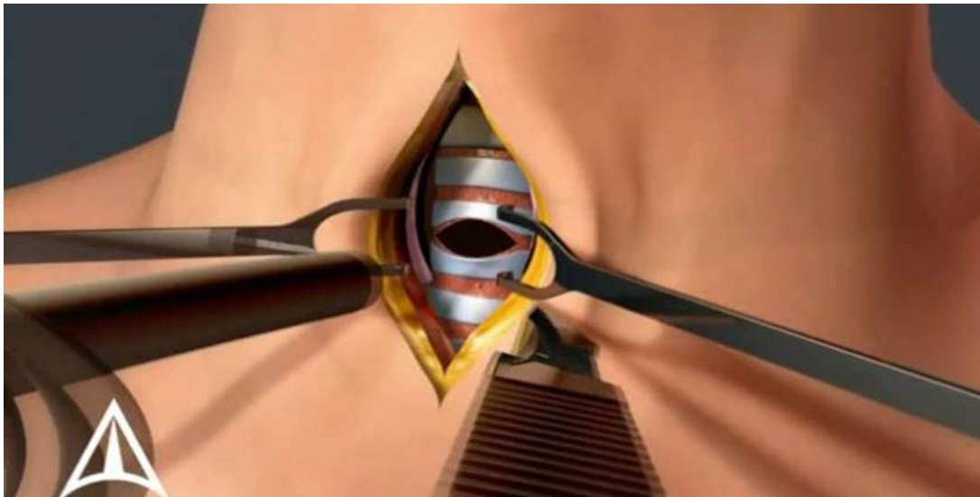
Slika 3.4.2.1. Prikaz traheotomije