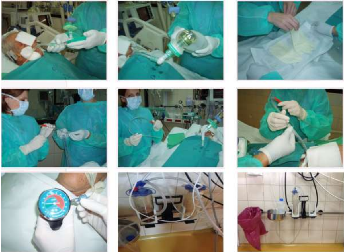
Slika 13.2.1. Prikaz aspiracije pacijenta i aspiratora [Autor: S.N]