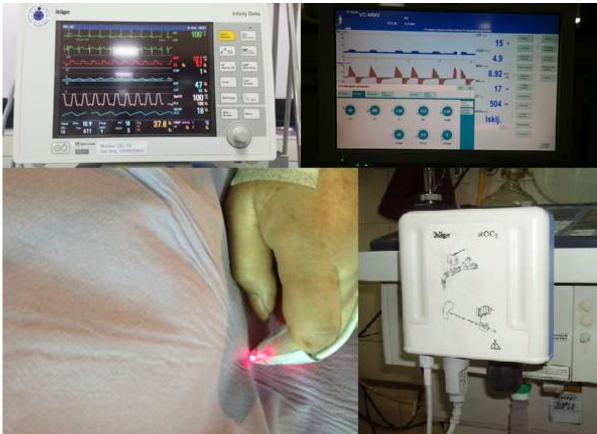
slika 7.1. Prikaz monitoringa respiracije; [Autor: S.N.]

Nadzor mehanički ventiliranog pacijenta jedan je od najvažnijih monitoringa vitalnih funkcija u jedinicama intenzivnog liječenja. Ono uključuje klinički nadzor, trajno praćenje kardiorespiracijskog statusa neinvazivnim metodama i invazivnim. Neinvazivne metode su praćenje načina disanja. Tu medicinska sestra mora obratiti pozornost na boju pacijenta, frekvenciju disanja, dubinu, ritam i trajanje pojedinih faza kao i da li pacijent upotrebljava pomoćnu dišnu muskulaturu ili pojavu paradoksnog disanja. Tu spada i pulsna oksimetrija, kapnografija. U invazivne metode praćenja plućne mehanike spada analiza plinova u arterijskoj krvi, invazivna oksimetrija, biokemijski i hemodinamski status. Praćenje na respiratoru: respiratorni volumen, minutni volumen, tlak u dišnim putevima, frekvencija disanja, postotak kisika u udahnutom zraku, trajanje udisaja i izdisaja. Može se prikazivati digitalno i grafički.