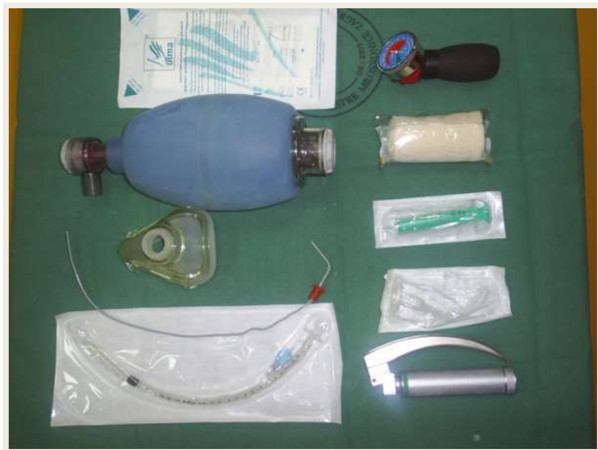
slika 9.1. Prikaz seta za intubaciju [Autor: S.N]