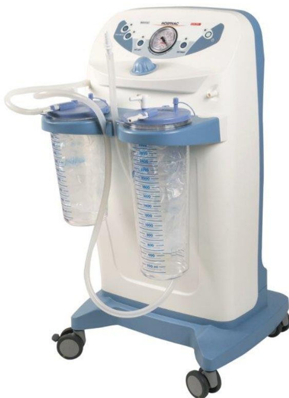
Slika 5.1.2.1. Medicinski aspirator

Važno je znati odabrati odgovarajući sterilni aspiracijski kateter. Uporaba prevelikoga katetera uzrokuje zatvaranje lumena kanile te uzrokuje hipoksiju. Pripremiti sterilne rukavice, masku, pregaču, pripremiti štrcaljku od 5 ili 10 ml, sterilnu fiziološku otopinu, te provesti higijensku antisepsu ruku (higijensko pranje i higijensko utrljavanje).