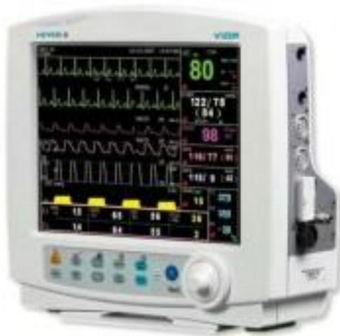
Slika 5.3.1. Monitor za praćenje vitalnih funkcija