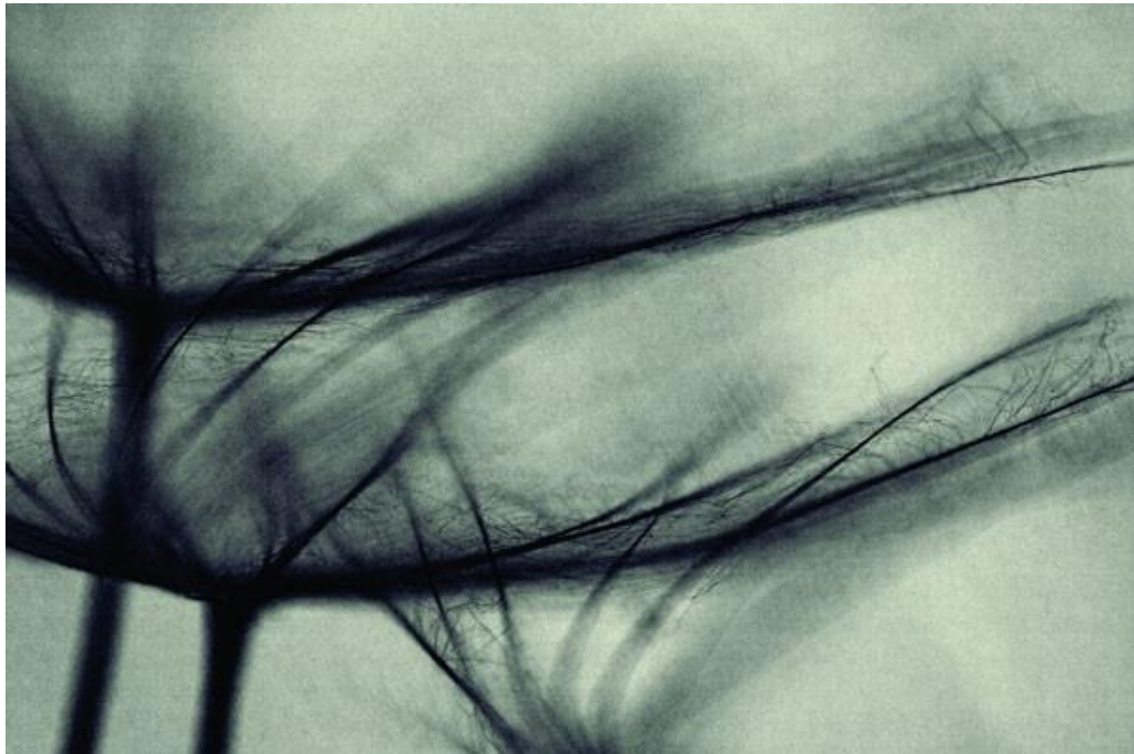
Slika 9.6.3. Valentina Bunić – Ishodište, 33. Zagreb Salon