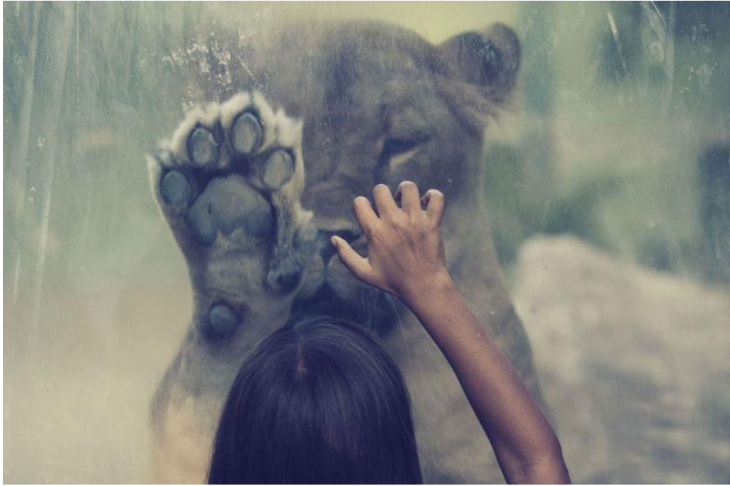
Slika 9.6.2. Robert Mataković – We Are One, 34. Zagreb Salon