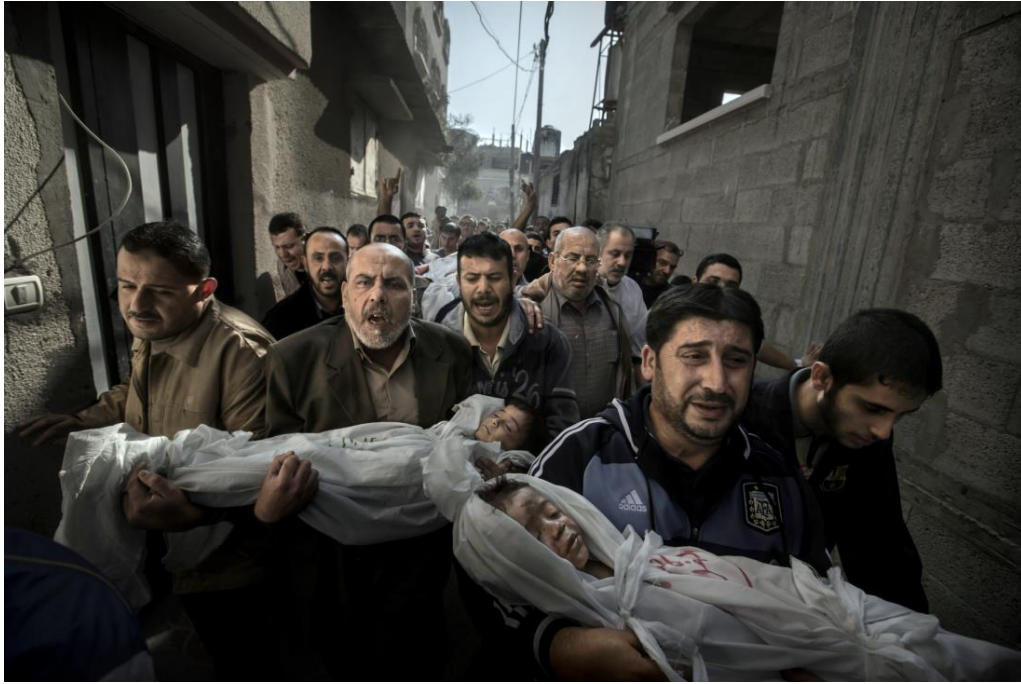
Slika 10.3. Paul Hansen, World press photo 2013.

Izraelski napad u gradu Gazi obilježio je World press photo natječaj 2013. godine. Fotografija prikazuje poginulu braću od dvije i četiri godine koje na sprovod u džamiju nose njihovi ujaci nakon urušavanje kuće u kojoj im je također poginuo otac, a ostali članovi obitelji su teško ozlijeđeni.