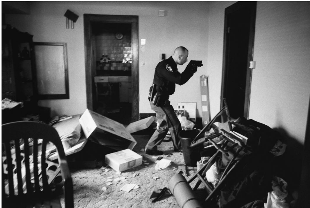
Slika 10.7. Anthony Seau, World press photo 2009.

Detektiv Robert Kole iz Clevelanda u Ohio-u provjerava kuću u procesu deložacije. Mora biti siguran da su vlasnici napustili prostorije i da u njoj ne postoji nikakvo oružje. Policija ulazi s usmjerenim pištoljima kako bi poštivali mjere sigurnosti jer su mnoge takve kuće uništenje i u njima se sakupljaju narkomani. Krajem 2007. godine, zbog propadanja američkih banaka, rate hipotekarnih kredita počele su naglo rasti. U prvim mjesecima 2008. godine, rast kamatnih stopa, zajedno s povećanjem nezaposlenosti i usporavanja na tržištu nekretnina, značilo je da mnogi više nisu mogli priuštiti plaćanje kredita na vlastite kuće. U sljedećim mjesecima, financijska kriza proširila se diljem svijeta.