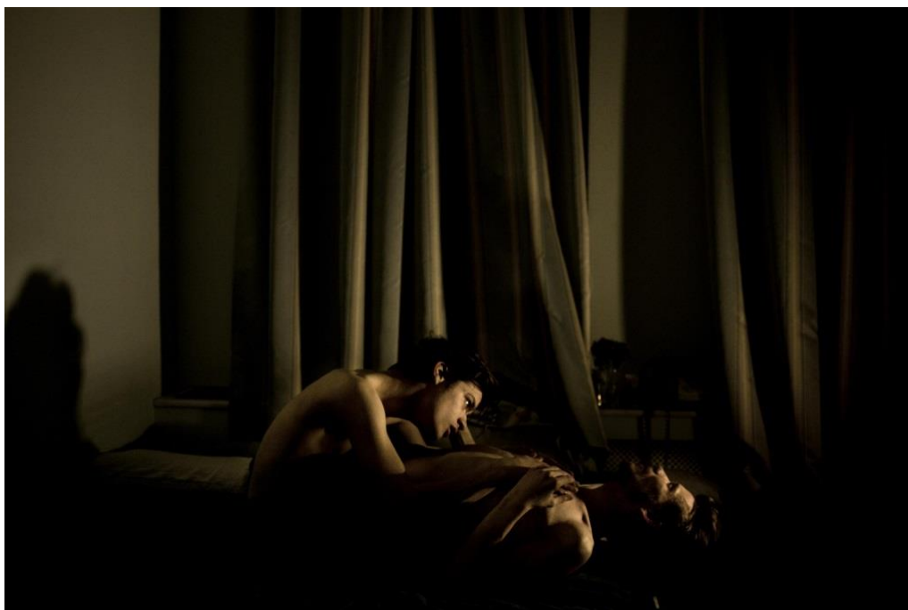
Slika 10.1. Mads Nissen, World press photo 2015.

U ovom poglavlju prikazane su i analizirane pobjedničke fotografije World press photography natječaja, najvećeg svjetskog natječaja novinske fotografije u kojima sudjeluju profesionalni novinski fotografi diljem svijeta. Redoslijedom od novijih prema kasnije snimljenim prikazane su najbolje fotografije u razdoblju od 2008. do 2015. godine sa navedenim autorima i detaljnim opisom svake od predočenih slika.