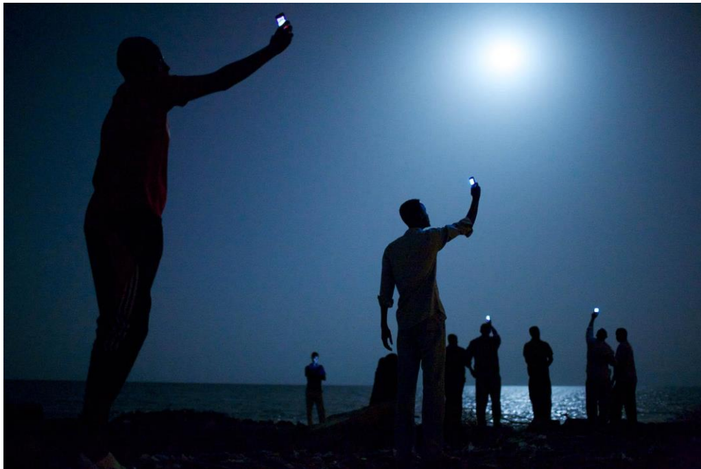
Slika 10.2. John Stanmeyer, World press photo 2014.

Pobjednička fotografija World press photo natječaja u 2014. godini prikaz je afričkih imigranata na obali grada Djibouti koji dižu mobitele kako bi uhvatili jeftin signal iz susjedne Somalije i došli u kontakt sa rodbinom u inozemstvu. Djibouti je česta stanica imigranata u potrazi za boljim životom u Europi i Bliskom istoku.