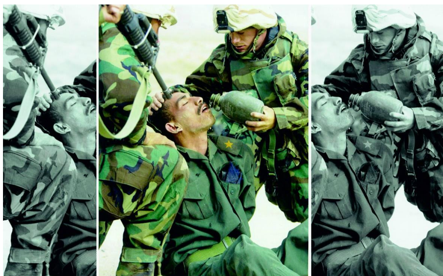
Slika 7.3. Različiti prikazi istog događaja

Gotovo da ne postoje ograničenja što se može primijeniti ili promijeniti na slici. Pitanje je samo, kada potraga za estetikom i originalnošću krši etiku?