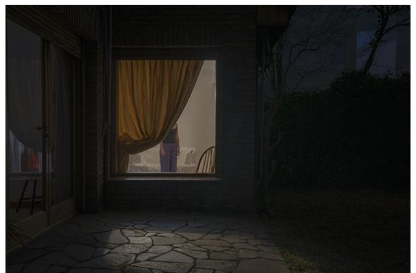
Slika 9.5.2. Rodrigo Illescas - Are you there, Grand Prix, Rovinj photodays 2015.