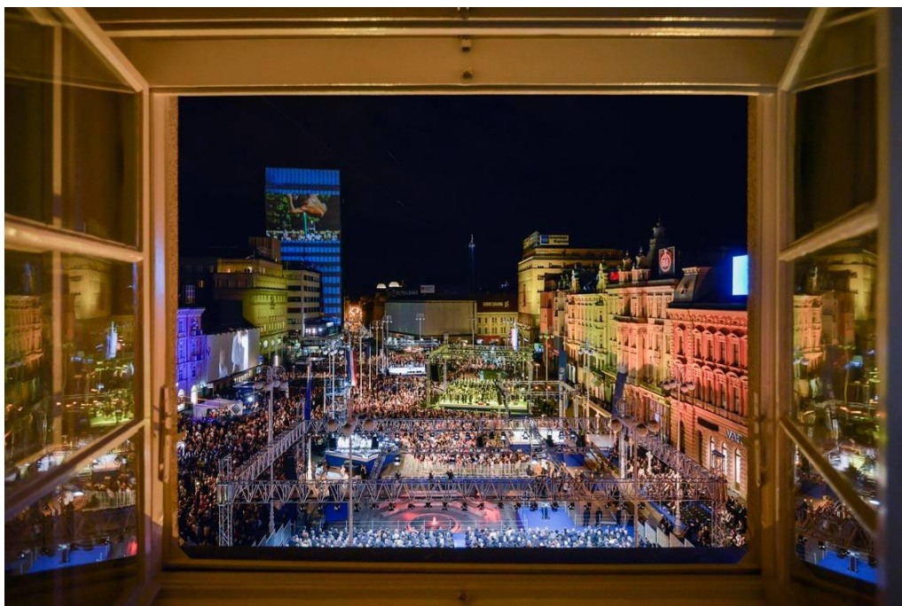
Slika 9.2.2. Neja Markičević, Hrvatska novinska fotografija 2013.

U Zagrebu, na Trgu Bana Jelačića, održana je središnja proslava povodom priključivanja Republike Hrvatske Europskoj uniji. Fotografija snimljena iz zgrade Zagrebačke banke, autorice Neje Markičević, proglašena je najboljom novinskom fotografijom 2013. godine.