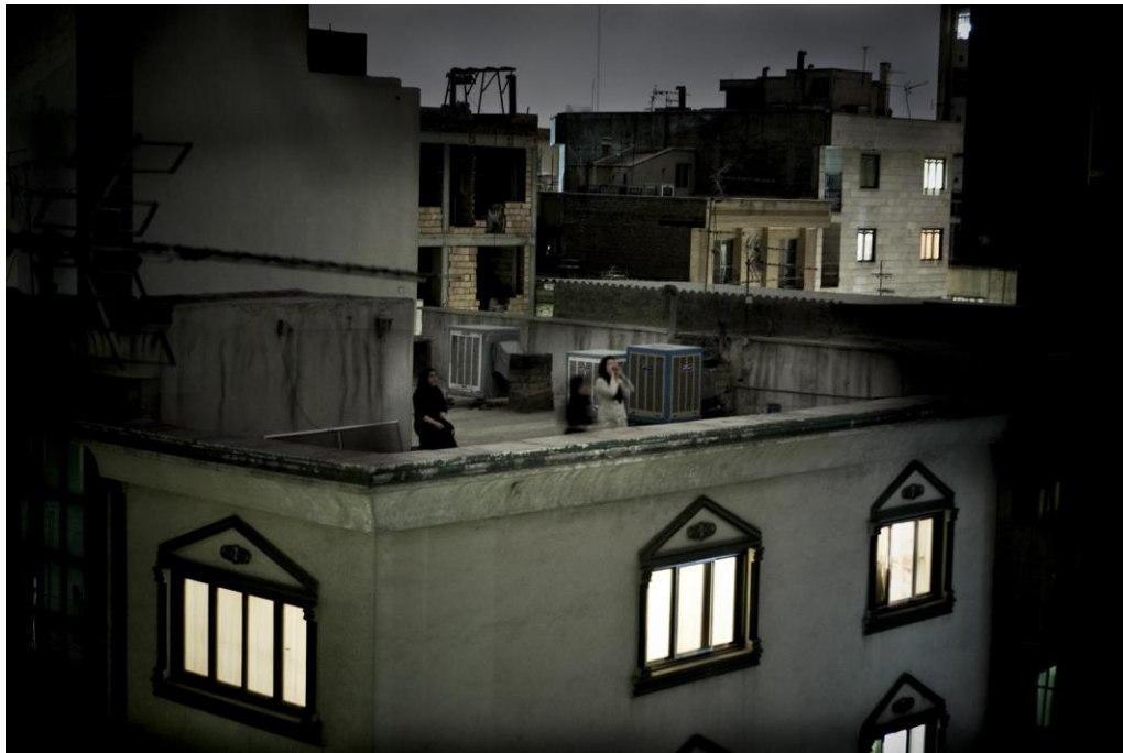
Slika 10.6. Pietro Masturzo, World press photo 2010.

Skupina žena, u gradu Theran, viču s krova u znak neslaganja nakon spornih iranskih predsjedničkih izbora u kojima je pobijedio Mahmud Ahmadinežad. Tjednima nakon izbora, na ulicama su se održavali nasilni prosvjedi. Noćima su se pobornici drugog predsjedničkog kandidata, Musavija, penjali na krovove i izražavali svoje nezadovoljstvo. Nakon dnevnih demonstracija, tišinu su kvarili su uzvici poput „Allahu Akbar!“ i „Smrt diktatoru!“. Takvi prosvjedi podsjećali su na proteste tokom islamske revolucije 1979. godine.