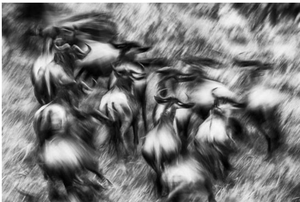
Slika 9.6.1. Mohammed Alnaser – Wild Run, 36. Zagreb Salon

Za svaku temu mogu se prijaviti četiri fotografije koje se žiriraju u četiri kruga ocjenjivanja. One će biti prikazane žiriju na monitoru u rezoluciji 1920x1200 px te se žiriranja dodjeljuju FIAP i PSA medalje i vrpce. Hrvatski fotosavez dodjeljuje prva tri mjesta i tri pohvale za svaku temu. Izuzetak je bio 35. Zagreb Saloon koji je bio organiziran kao pozivni, a ne natječajni. [20]