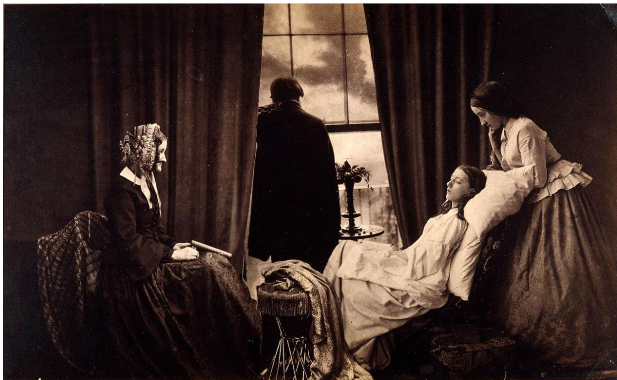
Slika 7.1. "Fading Away", Henry Peach Robinson, 1858.

Mnogi smatraju da su manipulacije počele s upotrebom programa za obradu fotografija kao što su Adobe Photoshop, Lightroom i ostali. No, postoje različiti primjeri iz povijesti, fotomontaže i fotokolaži odnosno spajanje više negativa kako bi se razvila jedna fotografija. Jedan od razloga za izradu takvih fotografija bio je vezan uz pejzažnu fotografiju. Zbog duge ekspozicije, nebo je uvijek bilo presvijetljeno u odnosu na prvi plan pa se zbog puke nužde da se nadoknade mane tadašnje tehnologije, fotografija sastavljala od dvije snimke. Najčešći primjeri dolaze upravo iz doba piktorijalizma i umjetničke fotografije oko 1900. godine odnosno početkom slika smisla kada su se u svrhu stilskog obilježja počele koristiti tehničke nesavršenosti, retuširanje i montaža. Jedna od najpoznatijih fotografija tog doba je „Fading away“ autora Henry Peach Robinson-a iz 1858. godine. [22]