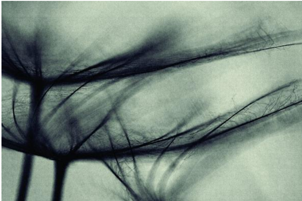
Slika 9.6.3. Valentina Bunić – Ishodište, 33. Zagreb Salon