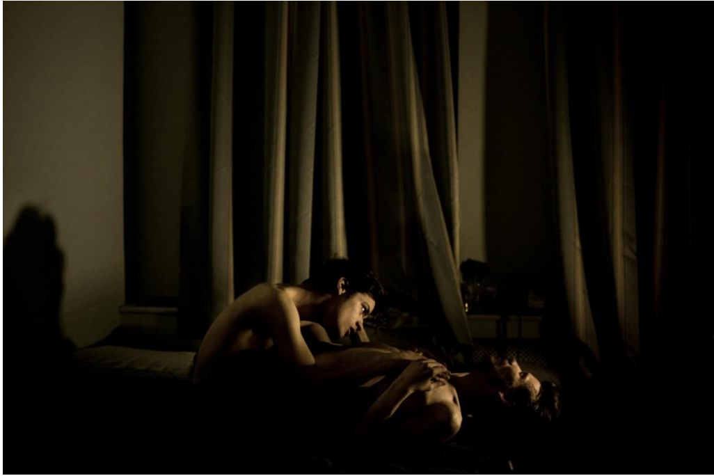
Slika 9.1.1. Mads Nissen, World press photo 2015.