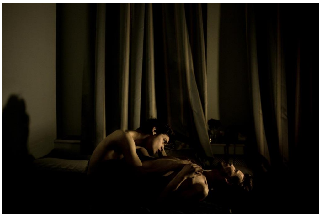
Slika 10.1. Mads Nissen, World press photo 2015.

U ovom poglavlju prikazane su i analizirane pobjedničke fotografije World press photography natječaja, najvećeg svjetskog natječaja novinske fotografije u kojima sudjeluju profesionalni novinski fotografi diljem svijeta. Redoslijedom od novijih prema kasnije snimljenim prikazane su najbolje fotografije u razdoblju od 2008. do 2015. godine sa navedenim autorima i detaljnim opisom svake od predočenih slika.