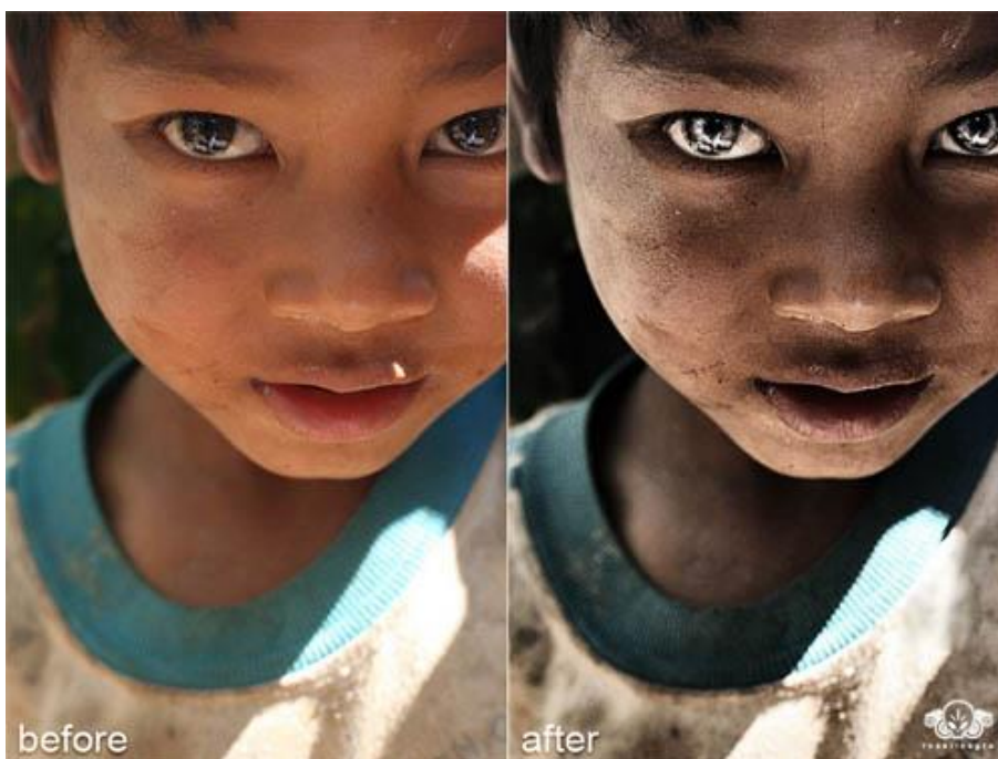
Slika 7.2. Pretjerana obrada fotografija

Osim manipulacije programima, velik problem predstavljaju iscenirane fotografije koje su najčešće u novinskoj fotografiji. Mnogi fotografi koji prekasno stignu na mjesto događaja pokušavaju ponovo stvoriti trenutak koji su propustili. Ponekad takvoj manipulaciji ne uvjetuje sam fotoreporter već i organizatori medijskih događanja koji daju upute subjektima kako se ponašati pred kamerama kako bi poslali određenu poruku kroz medije. [21]