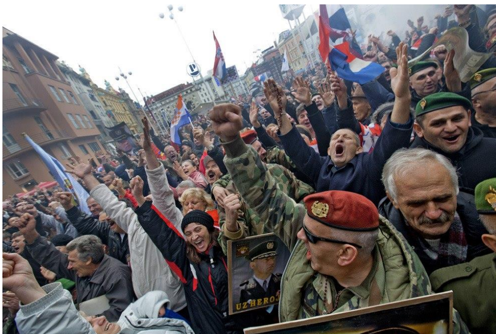
Slika 9.2.3. Nikola Šolić, Hrvatska novinska fotografija 2012.

U Zagrebu, na Trgu Bana Jelačića, održana je središnja proslava povodom priključivanja Republike Hrvatske Europskoj uniji. Fotografija snimljena iz zgrade Zagrebačke banke, autorice Neje Markičević, proglašena je najboljom novinskom fotografijom 2013. godine.