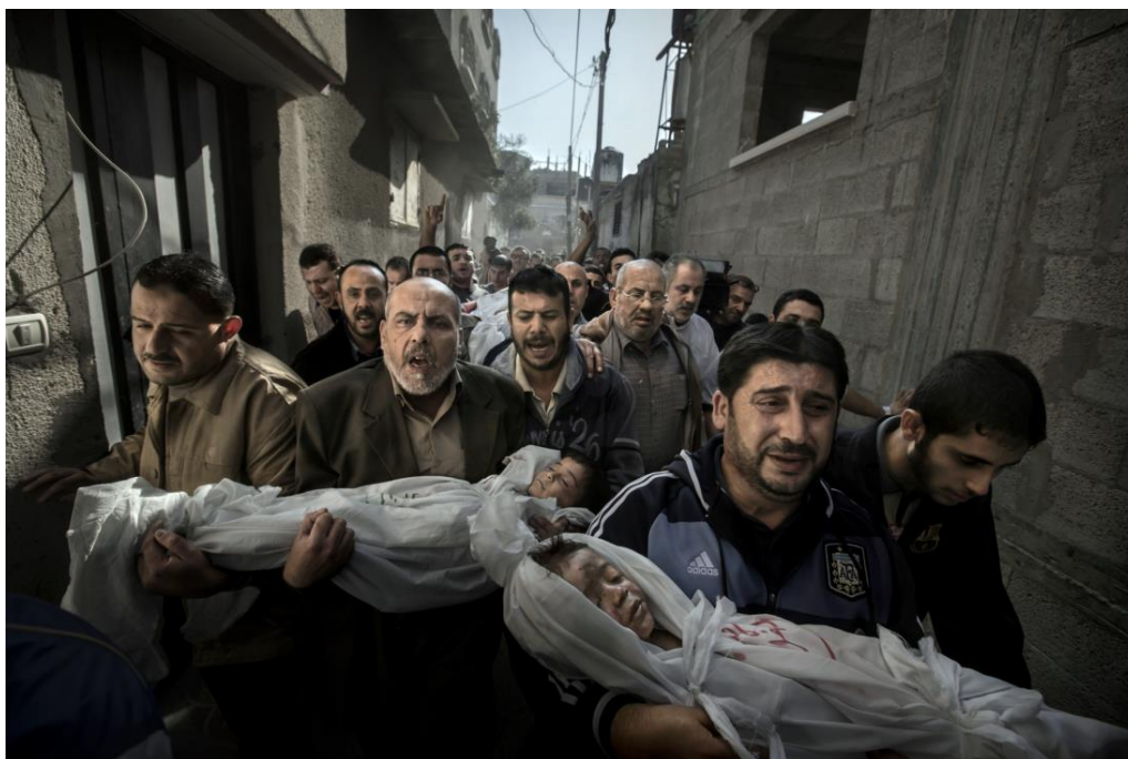
Slika 9.1.3. Paul Hansen, World press photo 2013.