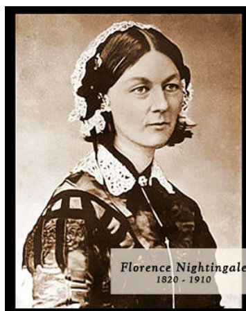
Slika 2.1.1. Osnivačica modernoga sestrinstva Florence Nightingale