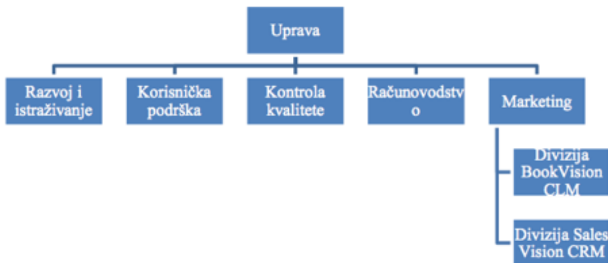
Slika 1. Shema organizacijske strukture Media-soft (rad autorice)

Prema priloženoj shemi Media-Soft ima pet glavnih odjela, a to su: