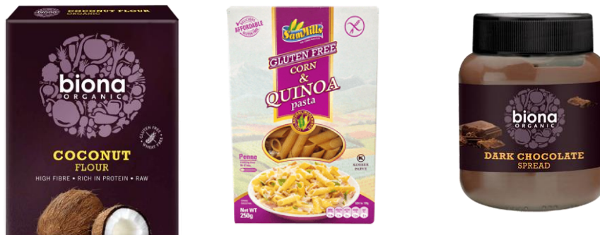
Slika 3.6.1. Industrijska hrana bez glutena.

bezglutensku dijetu. Zamjena za štetne žitarice mogu biti riža i kukuruz te uz malo umijeća mogu se pripremati jela vrlo slična onima koje sadrže zabranjene žitarice. U današnje doba postoji vrlo velika ponuda industrijskih proizvoda bez glutena.