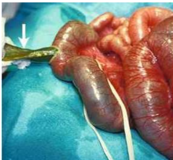
Slika 4.3.1. Prikaz opstrukcije crijeva mekonijem

Srednji ileum je proširen i ispunjen ljepljivom tamnozelenom masom, mekonijem, u proksimalnom dijelu dilatacija je manja, dok je distalni ileum sužen i ispunjen sasušanim mekonijem. Kolon je nerazvijen i malen. Intrauterina komplikacija je perforacija crijeva s razvojem sterilnog mekonijskog peritonitisa. Mekonij koji se raspe po trbušnoj šupljini vrlo brzo kalcificira.