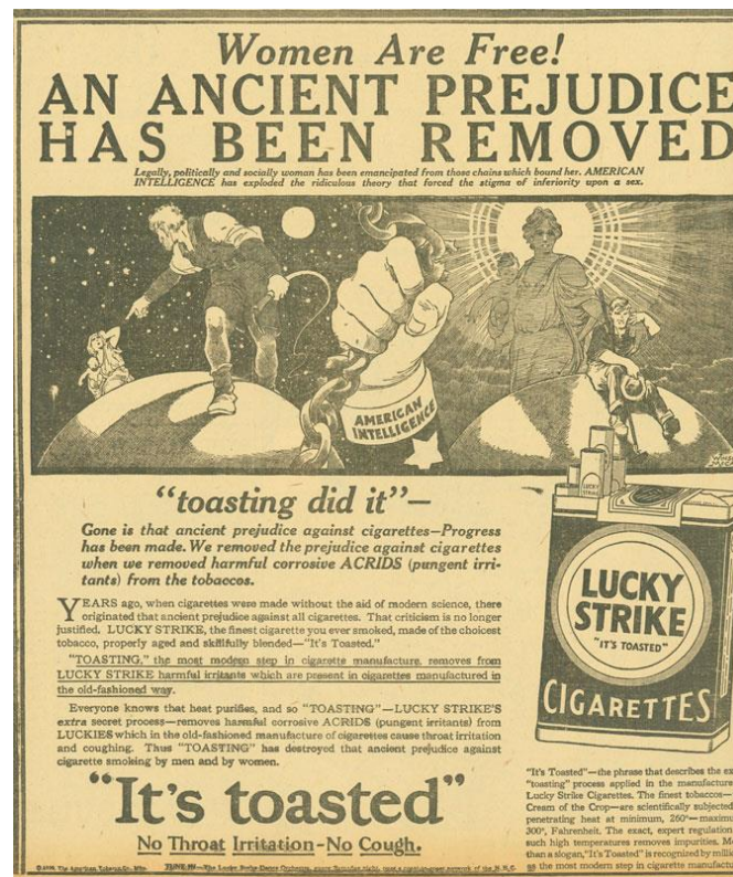
Slika 3.1 Primjer kampanje Lucky Strike cigareta s naslovom Žene su slobodne, stara predrasuda je uklonjena

Propaganda nije imala negativno ili podcjenjivačko značenje sve do nakon Drugog svjetskog rata. Hitlerovo glavno oružje bilo je govorništvo, a glavni zadatak svoje stranke vidio je u propagandi. (Alić, 2009: 98) Nakon što su se svi mogli uvjeriti u moć nacističke propagande za promicanje ideje Nationalsocijalističke stranke i antisemitizma, naročito korištenjem filma 1 , ne čudi što su se komunikatori držali podalje od tog pojma. No, propaganda je dio našeg svakodnevnog života, a vezana je uz političku i ekonomsku moć. Danas se pojavljuje kao reklama ili politička kampanja.