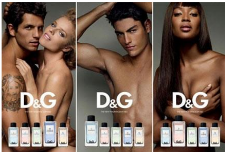
Slika 4.5. Reklama za D&G parfem koja nosi seksualne aluzije prikazivanjem golog tijela muškarca i žene

Jedan od primjera za reklamu koja koristi seksualne aluzije je reklama za Dolce & Gabbana parfem (Slika 5). Iako reklama ne sadrži direktno riječ sex , ova je reklama samo još jedan primjer kako tvrtke i marketinški stručnjaci koriste seksualne aluzije kako bi prodali proizvod. Sam parfem u ovom slučaju nije relevantan, već se u prvi plan stavlja idealno muško i žensko tijelo, a time se zapravo želi prenijeti poruka da će nas parfemi D&G ukoliko ih kupimo učiniti zadovoljnim. Takvi umetnuti podražaji mogu ostati u podsvjesnoj memoriji iznimno dugo, odnosno kroz čitav život. (Miliša, Nikolić 2013: 307)