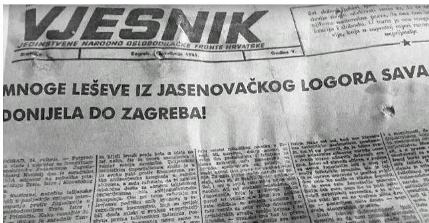
Slika 4.3.F alsificirana naslovnica Vjesnika, insert iz filma