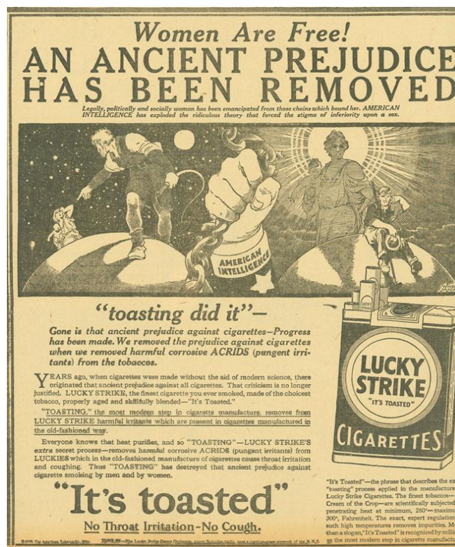
Slika 3.1 Primjer kampanje Lucky Strike cigareta s naslovom Žene su slobodne, stara predrasuda je uklonjena

Propaganda nije imala negativno ili podcjenjivačko značenje sve do nakon Drugog svjetskog rata. Hitlerovo glavno oružje bilo je govorništvo, a glavni zadatak svoje stranke vidio je u propagandi. (Alić, 2009: 98) Nakon što su se svi mogli uvjeriti u moć nacističke propagande za promicanje ideje Nationalsocijalističke stranke i antisemitizma, naročito korištenjem filma 1 , ne čudi što su se komunikatori držali podalje od tog pojma. No, propaganda je dio našeg svakodnevnog života, a vezana je uz političku i ekonomsku moć. Danas se pojavljuje kao reklama ili politička kampanja.