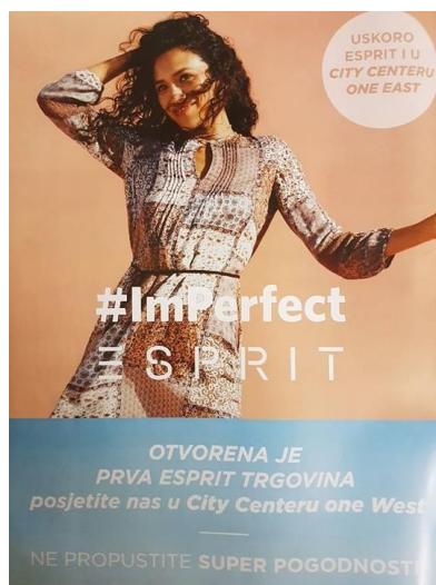
Slika 4.4. Espritova kampanja #ImPerfect, časopis Story

Časopis Story u ovom broju najviše pažnje posvećuje osobama s javne društvene scene, pišući o njihovim aferama i životnim navikama. Rubrika „party“ prikazuje slike slavnih s raznih događanja koja su se odvijala u Zagrebu. Na tim stranicama prevladavaju fotografije dok je u tekstu navedeno samo ime i prezime osobe koja se nalazi na slici. Nezaobilazni atributi koji stoje uz fotografije poznatih osoba su: „Najbolje društvo“, „Prave Cosmo cure“, „Šarmantne dame“, „Bezvremenska elegancija“. Ovog mjeseca Story i rubrika „moda“ darovali su kupone od 30% popusta u odabranim prodavaonicama. Odjeća za koju se mogao iskoristiti popust zapravo je preskupa za „obične građane“ jer si rijetko tko može priuštiti Hilfiger denim baloner u iznosu od 1.509,00 kuna ili Guess Marciano košulju u iznosu od 1.240,00 kuna. Primjetno je da se u časopisu najčešće prikazuju ženska odjeća, obuća i modni dodatci dok je muškarcima posvećena tek stranica ili dvije.