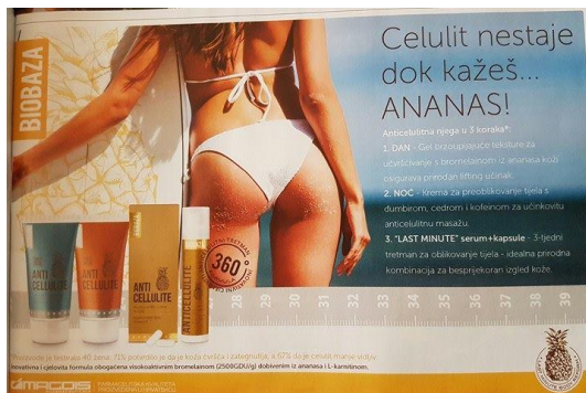
Slika 4.7. Primjer oglasa u časopisima, časopis Story

istraživanju koje su proveli 71% žena potvrdilo je da je koža čvršća i zategnutija, a 67% da je celulit manje vidljiv. 35